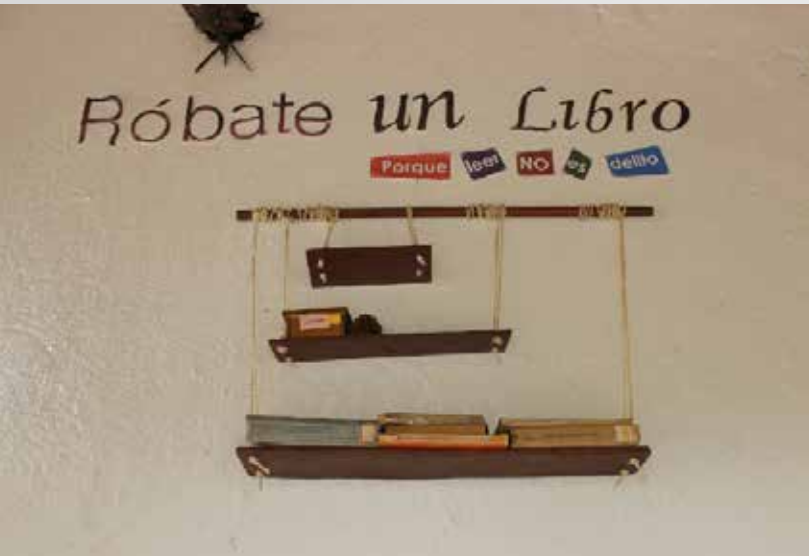
Róbate un libro, Oficina del Estudiante - Campus Pamplona