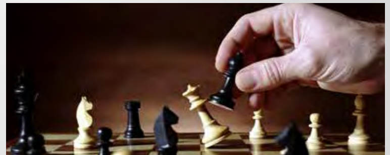
Juego de ajedrez, imagen de internet

Nada como tener un espacio en el que te puedas divertir con tus amigos, practicar algún deporte o juegos que impliquen desafíos mentales. En Ofiestudiante lo sabemos, por eso estamos preparando un proyecto que te dará qué hacer. Juegos de mesa es una iniciativa que busca que los estudiantes de la Unipamplona disfruten y aprovechen su tiempo libre, por esto realizamos una encuesta con el objetivo de conocer los gustos de los universitarios y los que participaron eligieron sus preferidos. En nuestra Oficina queremos ofrecerles espacios donde puedan divertirse con juegos como jenga, ajedrez, parqués, tenis de mesa, póker y muchos más. Así que ya sabes, mantente al tanto de nuestras páginas para saber cómo va este proyecto y poder participar en él.