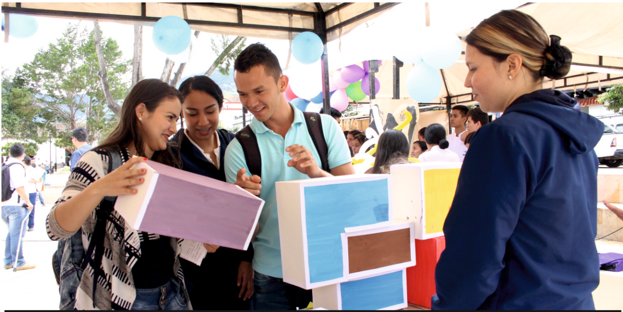
Los pamploneses participaron de las actividades organizadas por los estudiantes de Enfermería para promocionar la salud.

El programa de Enfermería de la Universidad de Pamplona desarrolló en el parque Águeda Gallardo de Pamplona un evento denominado, "Somos Enfermería UP", con el objetivo de dar a conocer a la comunidad las diferentes etapas históricas de la enfermería, además de promocionar la salud y prevenir la enfermedad a través de representaciones teatrales, charlas educativas, toma de la tensión y vacunación a la población de la tercera edad.