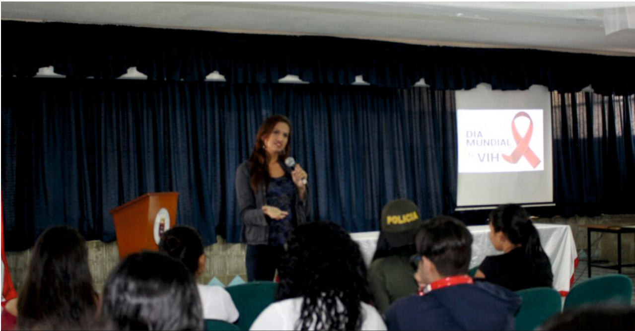
La semana de la salud sexual y reproductiva contó con la presencia de importantes conferencistas en el campo.

El programa de Enfermería de la Universidad de Pamplona organizó, como cada semestre, la semana de la salud sexual y reproductiva dirigida a toda la comunidad estudiantil, con el objetivo de promover una salud sexual sana y responsable, además de contribuir con la prevención de enfermedades de transmisión sexual o ITS como el sida, la gonorrea, la sífilis, el VPH, el cáncer de cuello uterino, entre otros.