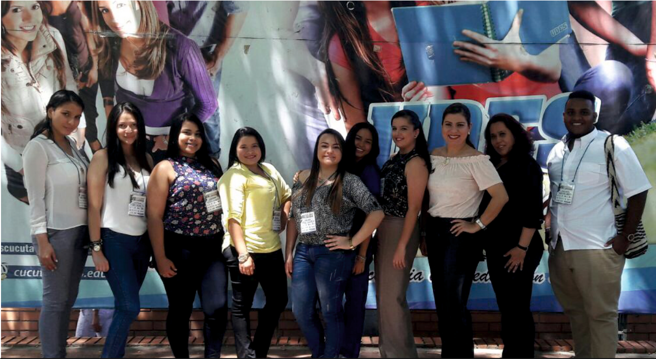
Los jóvenes compartieron las experiencias adquiridas durante su pregrado.

Los estudiantes de Terapia Ocupacional de la Universidad de Pamplona participan en el VII Encuentro Colombiano de Estudiantes de Terapia Ocupacional que se desarrolla en el auditorio Andrés Bello Parra de la Universidad de Santander, UDES sede Cúcuta, al cual asisten representantes de otras instituciones como la Universidad Nacional, la Universidad Mariana, la Universidad de Valle, la Escuela Nacional del Deporte, la Universidad de Santander, la Escuela colombiana de Rehabilitación y la Universidad Manuela Beltrán. Durante el evento los alumnos de último semestre dieron a conocer tres propuestas de investigación de las siete que fueron enviadas ante el comité de selección del encuentro. Dichos proyectos se denominan: “efectos