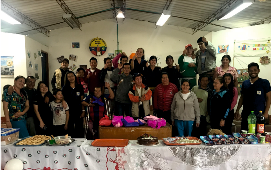
Los habitantes del barrio Santa Marta de Pamplona disfrutaron de las actividades preparadas por los estudiantes de la universidad.

Los estudiantes de cuarto semestre del programa de Terapia Ocupacional realizaron su práctica formativa del nivel I comunitario con la población discapacitada de los barrios Santa Marta, Simón Bolívar y