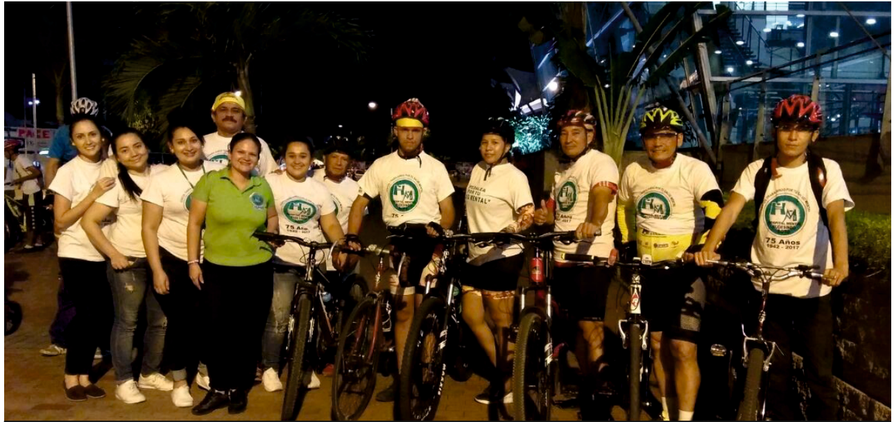
“Pedalea por tu salud mental” fue el nombre de una de las actividades realizadas durante la conmemoración del día de la salud mental

Por: Marisol Urrea, docente de Terapia Ocupacional