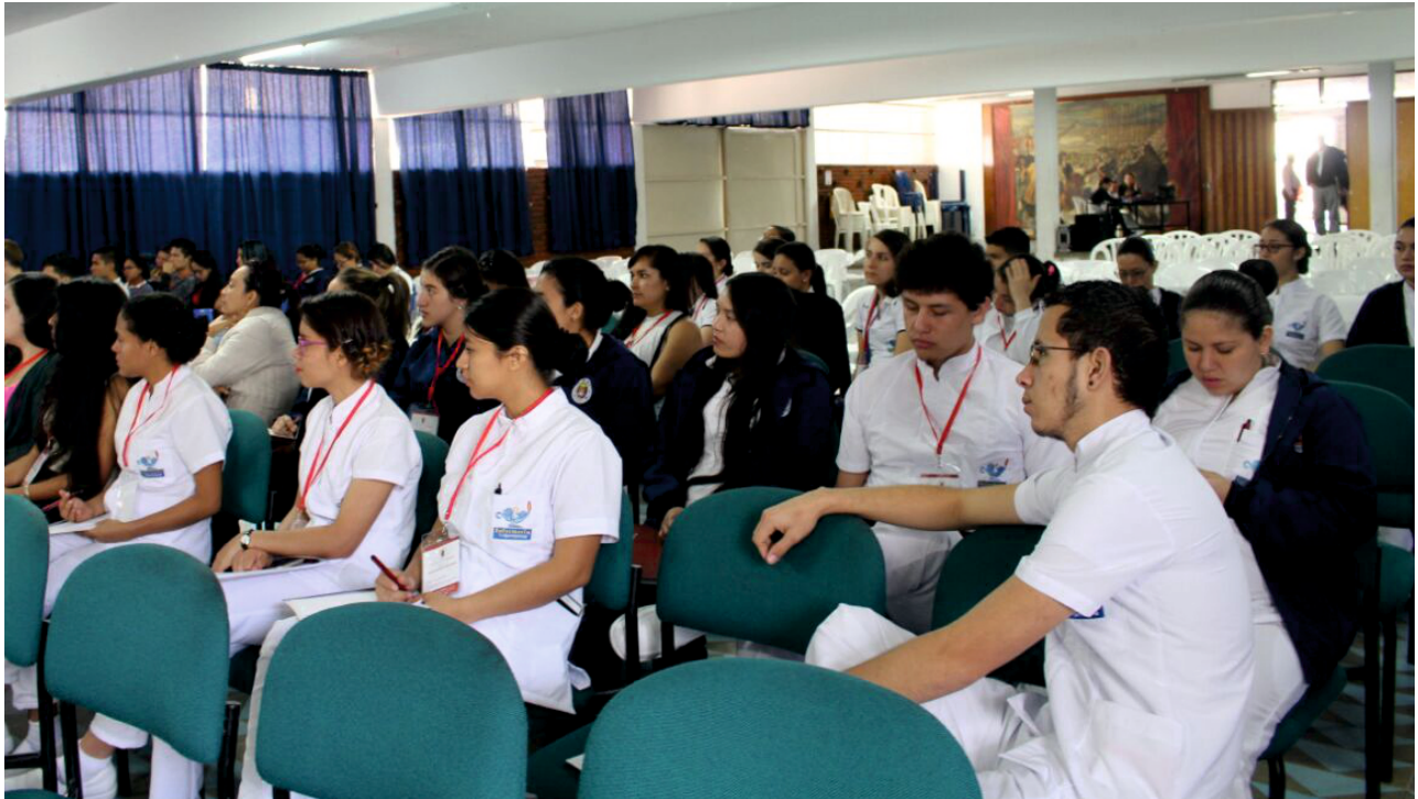
Más de 100 estudiantes participaron de la actividad tanto en Pamplona como en Cúcuta.

Alrededor de 100 estudiantes de enfermería participaron de la II Jornada de Actualización que se llevó a cabo en la sede Nuestra Señora del Rosario de Pamplona y en la Facultad de Salud de Cúcuta.