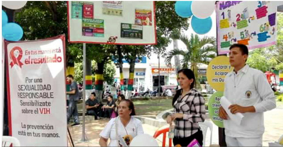
Uno de los objetivos de la jornada fue la atención an inmigrantes venezolanos en Villa del Rosario y Los patios

Por: C.S Fanny Cáceres González /Ofi-prensa Villa del Rosario