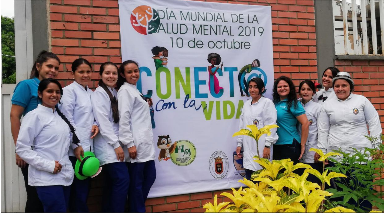
Los estudiantes de Terapia Ocupacional sensibilizaron a los asistentes sobre la importancia de la salud mental, especialmente en niños y jóvenes.

El Programa de Terapia ocupacional se unió a la conmemoración del día mundial de la salud mental y desarrolló en el Hospital Mental Rudesindo Soto, una jornada pedagógica con los directivos, equipo terapéutico de la institución y estudiantes de Terapia ocupacional y Psicología de la Universidad de Pamplona.