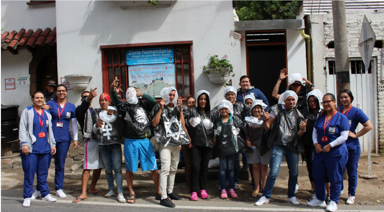
En la foto, los migrantes venezolanos muestran los sobretodos elaborados durante un taller para protegerse del frío y la lluvia.