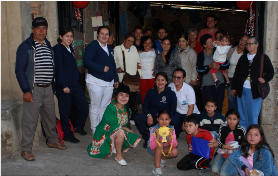
Los habitantes del barrio Santa Marta participaron de la jornada en cada uno de los puntos de reunión de la localidad.

Los estudiantes y docentes de la asignatura "Cuidados de Enfermería en Salud Comunitaria I" del programa de Enfermería Unipamplona desarrollaron una gran jornada de promoción de la salud y prevención