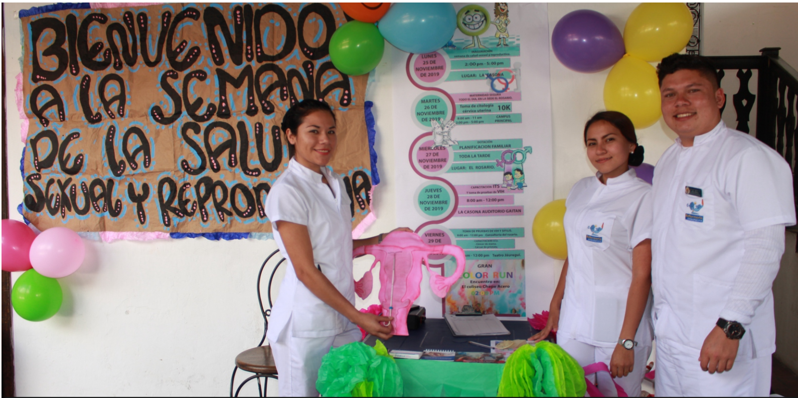
Los estudiantes de Enfermería Unipamplona y de la asignatura en salud sexual y reproductiva elaboran el material didáctico con el que promueven una sexualidad sana y responsable

El programa de Enfermería de la Universidad de Pamplona continúa trabajando para promover entre los jóvenes una sexualidad sana y responsable a través de diversas estrategias de comunicación y educación que buscan prevenir enfermedades de transmisión sexual como, por ejemplo: VIH, sífilis o clamidia, y asociadas a los órganos reproductivos como el cáncer de seno, de testículo o de cuello uterino. De igual manera con el proyecto de interacción social en Salud Sexual y Reproductiva (Saser), se sensibiliza a la comunidad universitaria acerca de la violencia sexual o de género; la identidad y orientación sexual diversa, maternidad segura, aborto y métodos de planificación familiar. Es por estas razones que semestre a semestre y desde hace aproximadamente 15 años, se llevan a cabo jornadas educativas de la mano de docentes y profesionales invitados, quienes asesoran individualmente y de manera general a los universitarios. Con