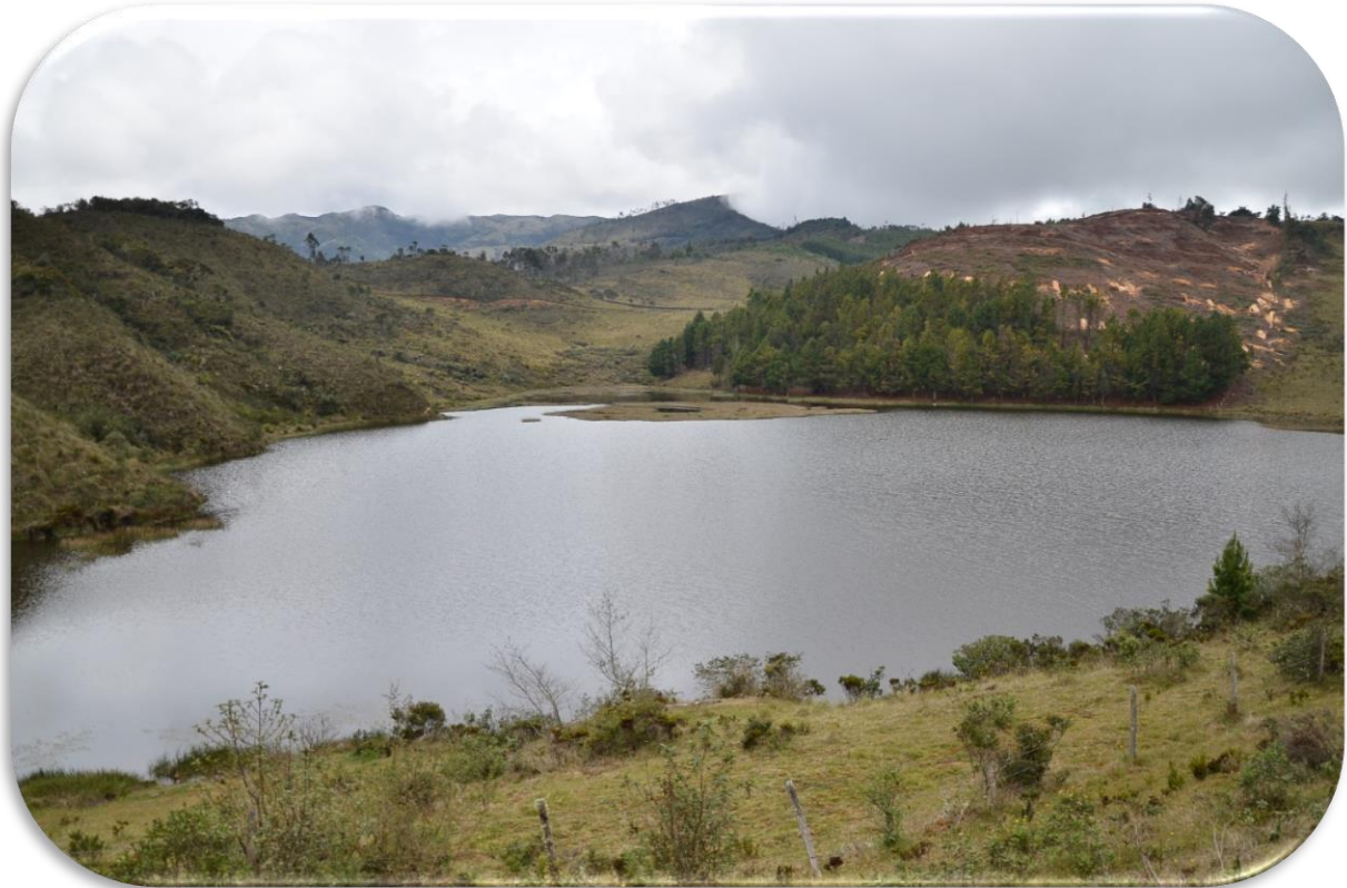
Laguna del Cacique Cáкота

La laguna de Cáкота es un ecosistema acuático natural con un área aproximada de 1.5 hectáreas, situada a 2.900 m.s.n.m en la vereda Mata de Lata del municipio de Cáкота, a cinco kilómetros del casco urbano. Es alimentada por dos nacientes, la principal proveniente de una zona de frailejones alledaña, y su nivel varía con las condiciones climáticas.