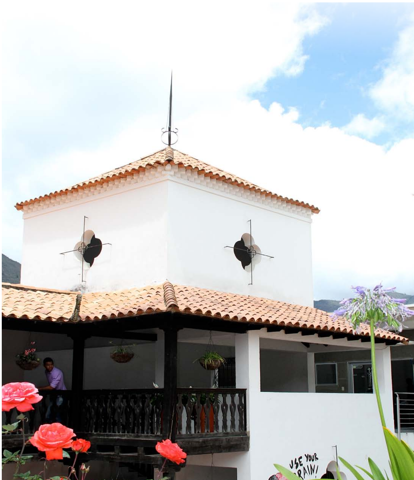
Facultad de Artes y Humanidades (Casona)