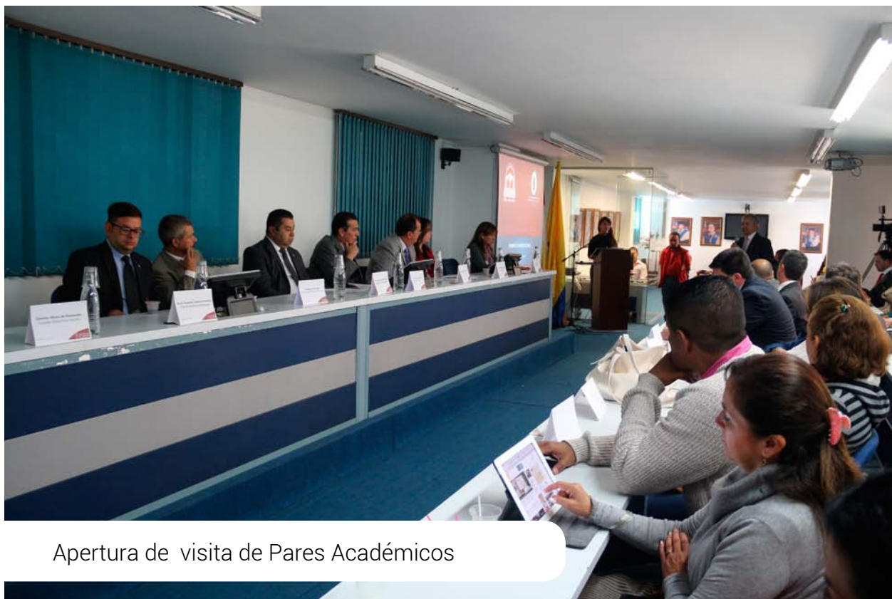
Apertura de visita de Pares Académicos

Todos los programas de Educación Superior necesitan presentar y asegurar unas condiciones de calidad para ser ofertados. Estas condiciones se validan a través de una Resolución que otorga el Ministerio de Educación Nacional (MEN), establecida en el Decreto Único Reglamentario del Sector Educación, 1075 del 26 de mayo de 2015, y la cual se denomina Registro Calificado.