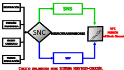
Fig. 1. Circuito realimentado Sistema Nervioso-Corazón.

De acuerdo con lo anterior, podemos decir que hay estudios, en donde se evidencia la afectación precoz del SNA en la Enfermedad del Parkinson (EP) y Parkinsonismos (Kallio et al. , 2000), (Haapaniemi et al. , 2001) Figura 1. En particular, existe una interacción entre SNA y el corazón, el cual funciona como sistema realimentado a través del Sistema Nervioso Central (SNC), en donde se envían estímulos y son utilizados por el SNA, para dar respuesta ante un fenómeno que altera la frecuencia cardíaca en el corazón a través del nodo sinusal ó marcapasos, estas alteraciones varían y se ven reflejadas en un test de comparación del ritmo cardíaco. Según la literatura, los cambios de actividad permiten al corazón obtener fluctuaciones en la frecuencia cardíaca, de tal forma que influyan en el SNA, ya sea a nivel del sistema nervioso simpático SNP, en donde el ritmo cardíaco se hace más lento, ocasionando una Bradicardia, mientras que en el sistema nerviosos parasimpático SNP, el ritmo cardíaco se acelera ocasionando, el ritmo cardíaco oscila entre 90 a 110 pulsaciones por minuto. Asimismo, existe un patrón que modula los dos sistemas cardiacos nombrados anteriormente, se llama Variabilidad de la Frecuencia Cardíaca VFC, que se define como la variación del periodo de la señal ECG con el tiempo (Marco V, José et al. , 2014). Figura 2.