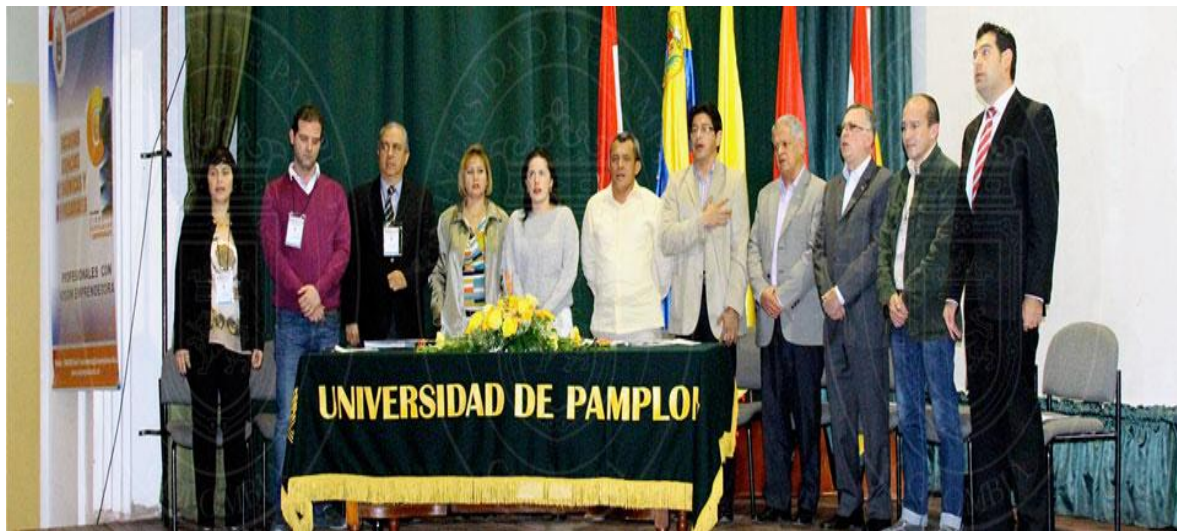
Ponentes e Invitados Especiales