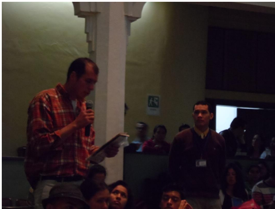
Participación de los invitados del V Foro de Desarrollo Economico