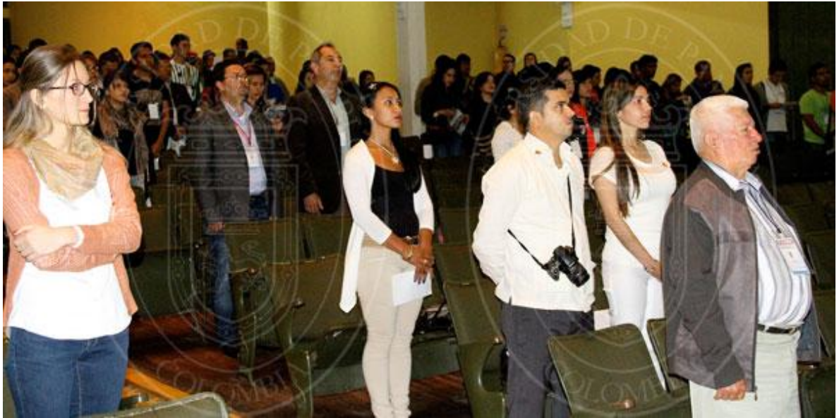
Personas que participaron en el evento