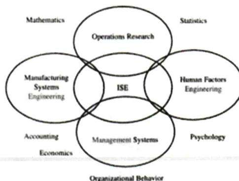
Imagen 2. integración de áreas afines de conocimiento a la Ingeniería Industrial y Sistemas 7