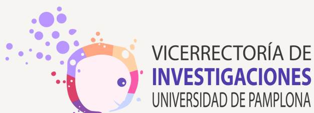
Cambios en el color institucional