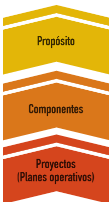
Figura 1. Modelo de propuesta jerárquica para hacer seguimiento al cumplimiento de metas.

para asegurar la sostenibilidad, calidad, transparencia y mejora continua de las políticas, procedimientos y procesos. Un sistema de información es recomendado para poder visualizar el progreso que se está teniendo en cada uno de los indicadores o metas. A continuación, se presenta una propuesta de jerárquica que puede ser establecida para el seguimiento del cumplimiento de metas: