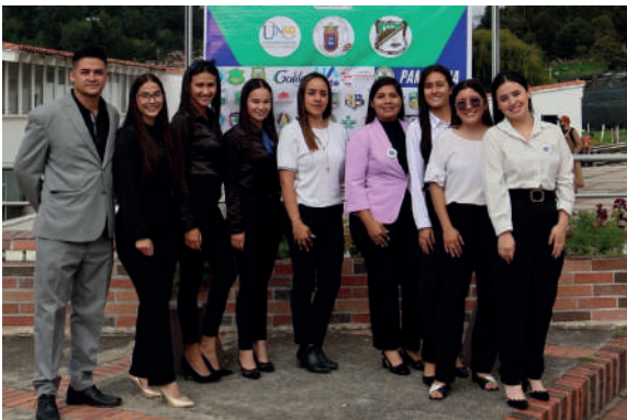
Estudiantes de fonoaudiología participantes del REDCOLSI, fotografía por el programa.