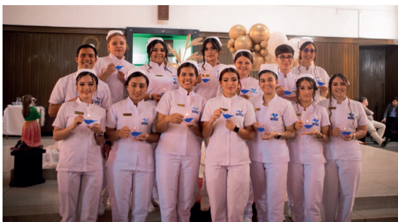
Fotografía de los estudiantes en la ceremonia de la luz, fotografía por Paula Rojas.