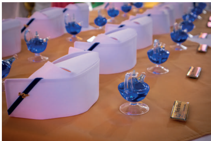
Elementos entregados a los estudiantes de quinto semestre en la ceremonia de la luz.

La Ceremonia de la Luz es una tradición que simboliza la transmisión de conocimientos y valores esenciales en la enfermería. Durante la ceremonia, cada estudiante recibe una vela encendida, representando la luz del conocimiento y la dedicación que guiará su camino profesional. Este momento especial no solo destaca el esfuerzo y la dedicación de nuestros estudiantes, sino que también fortalece su sentido de responsabilidad y empatía hacia los pacientes.