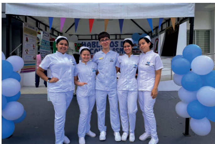
Estudiantes del programa de Enfermería en la Universidad de Pamplona en la campaña Pedagógica de Prevención del Alcoholismo y Jornada de Prevención de Riesgo Cardiovascular, fotografía por Paula Rojas, estudiante de Comunicación Social.

Estas actividades reflejan el compromiso del programa de Enfermería de la Universidad de Pamplona con la promoción de la salud y la prevención de enfermedades en la comunidad, fortaleciendo el vínculo entre la universidad y la población de Pamplona.