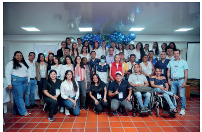
Participantes y jurados del III Foro de Diversidad, Inclusión e Igualdad desde el eje de cultura de y Deporte.