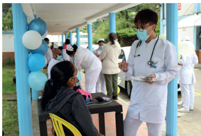
Estudiantes del programa de Enfermería en el Hospital San Juan De Dios en la campaña Pedagógica de Prevención del Alcoholismo y Jornada de Prevención de Riesgo Cardiovascular

La campaña pedagógica sobre la prevención del alcoholismo, organizada por estudiantes de la asignatura "Cuidado Básico", se desarrolló en colaboración con el personal administrativo de la Universidad de Pamplona. Simultáneamente, se realizó una jornada de prevención de riesgo cardiovascular en las instalaciones del Hospital San Juan de Dios de Pamplona, promoviendo el bienestar de la población y contribuir a la disminución de enfermedades crónicas como la hipertensión y la diabetes.