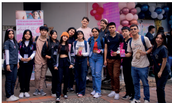
Fotografía de los estudiantes de Medicina junto a estudiantes de otras carreras en la V feria de la Salud, fotografía por Paula Rojas, pasante de comunicación.

La participación de estos estudiantes no solo demostró su competencia técnica, sino también su capacidad para conectar y comunicar efectivamente con diferentes públicos, preparando así a los futuros médicos para enfrentar los retos de la comunicación en su práctica profesional, ya que utilizando estrategias de empatía, asertividad y un adecuado manejo del lenguaje verbal y no verbal, los estudiantes se aseguraron de que la información proporcionada fuera clara y útil para los asistentes.