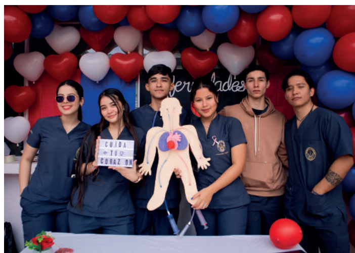
Fotografía de los estudiantes de Medicina en la V feria de la Salud.

La actividad se enfocó en brindar información técnica en salud de manera accesible y comprensible para todos los asistentes. Los estudiantes utilizaron habilidades de empatía, asertividad y comunicación efectiva, tanto verbal como no verbal, para explicar condiciones médicas y temas de salud en un lenguaje sencillo y claro. Este enfoque buscó preparar a los futuros profesionales de la salud para que sean capaces de transmitir información técnica de manera comprensible y efectiva en su futura práctica profesional.