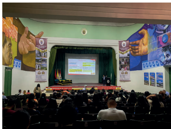
Estudiantes del programa de Fisioterapia durante una de las ponencias del Segundo seminario de actualización y enfoques terapéuticos basados en la evidencia, fotografía por Paula Rojas.

Este seminario ofreció una oportunidad única para estar al tanto de las últimas innovaciones, compartir conocimientos, experiencias, y conectarse con otros profesionales apasionados por la rehabilitación, aportando nuevos conocimientos para los próximos profesionales. Además, constituyó un espacio propicio para la creación de redes de colaboración entre profesionales y estudiantes interesados en estos campos de estudio.