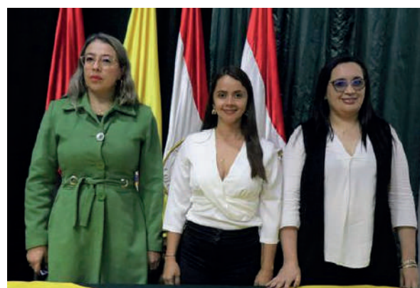
Fotografía de las docentes del programa de Fisioterapia en el Segundo seminario de actualización y enfoques terapéuticos basados en la evidencia.

Contaron con una destacada lista de ponentes, incluyendo dos egresados destacados del programa, un ponente internacional y cuatro docentes, todos expertos en sus campos.