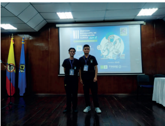
Presentación de los estudiantes del programa de Bacteriología y Laboratorio Clínico en el III Simposio Estudiantil de Correlación Clínica, fotografía por los estudiantes.