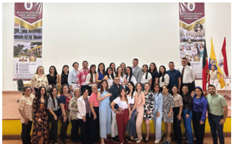
Docentes de Fonoaudiología en XXXVI Salón de Investigación e Innovación en Comunicación Humana (COMHUM)