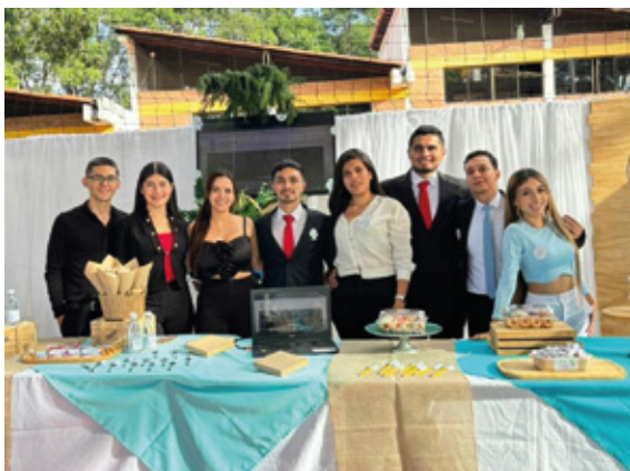
Estudiantes participantes en la muestra empresarial, fotografía proporcionada por el programa de Fonoaudiología.