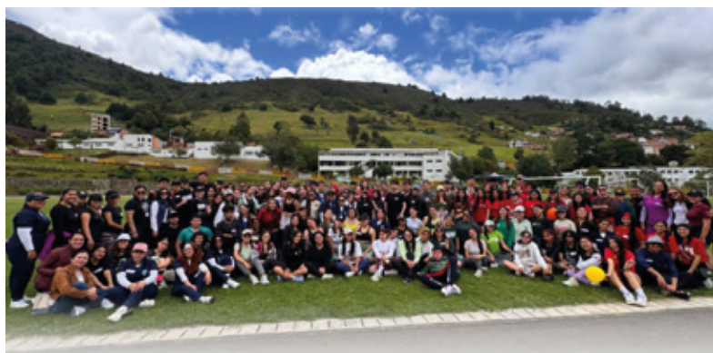
Estudiantes y docentes del programa de Psicología en el Primer encuentro de estudiantes para estudiantes - Psicojuntos, fotografía por Paula Rojas, pasante de comunicación social.

Las actividades recreativas incluyeron juegos y dinámicas diseñadas para promover la interacción y el conocimiento mutuo entre los estudiantes de diferentes semestres. La integración y el bienestar integral son componentes clave para el éxito académico y personal, y este evento demostró ser un valioso paso hacia la consecución de estos objetivos.