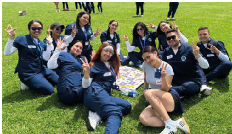
Estudiantes de Psicología en el Primer encuentro de estudiantes para estudiantes - Psicojuntos, fotografía suministrada por el programa.

El Departamento de Psicología de la Universidad de Pamplona, a través del equipo CAIPLA (Centro de Atención Integral Psicológica y de Logopedia Aplicada), organizó un evento especial dirigido a los psicólogos en formación, abarcando desde primer hasta décimo semestre. Este evento contó con la activa participación de docentes y estudiantes del departamento, así como con el apoyo de Bienestar Universitario y el programa de Educación Física, Recreación y Deportes. La colaboración de estos diferentes grupos fue fundamental para el éxito del evento, creando un ambiente de integración y cooperación entre los estudiantes y el personal universitario.