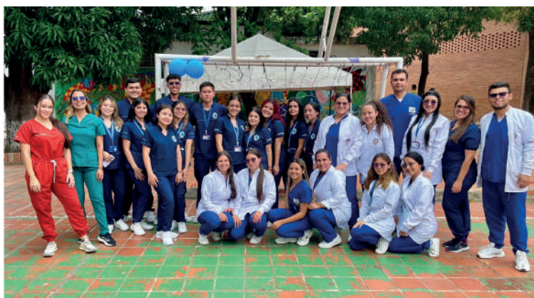
Docentes y estudiantes de Psicología y Terapia Ocupacional en el Hospital Mental Rudesindo Soto, fotografía por el programa de Psicología.

Se centró en un enfoque integral de la vida, considerando tanto los factores protectores como los de riesgo asociados con el consumo de drogas. Se prestó especial atención a las actividades de ocio y tiempo libre como medio para desviar la atención del consumo de sustancias y fomentar actividades positivas. Durante el encuentro, se promovió activamente la construcción de redes de apoyo entre los pacientes, así como la estimulación cognitiva a través de diversas actividades interactivas.