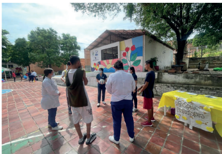
Estudiantes de Psicología y Terapia Ocupacional en el Hospital Mental Rudesindo Soto.

La organización de esta campaña demostró el compromiso de la Universidad de Pamplona con la formación de profesionales competentes y dedicados al bienestar de la comunidad.