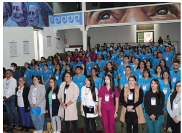
Estudiantes y docentes participantes en el II Encuentro de Investigación Formativa y Proyectos de Intervención, fotografía proporcionada por la oficina de prensa de la UniPamplona.