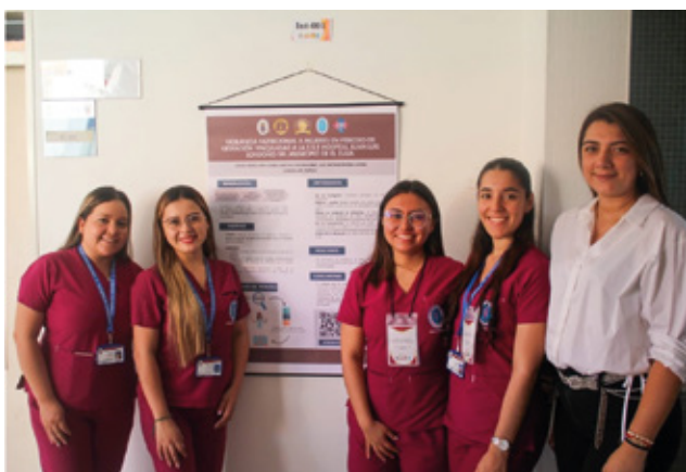
Estudiantes participantes en la presentación de Poster en el II Encuentro de Investigación Formativa y Proyectos de Intervención, fotografía proporcionada por la oficina de prensa de la UniPamplona.

> El II Encuentro de Investigación Formativa y Proyectos de Intervención culminó con éxito, destacando varios logros importantes: Presentación de Proyectos, Innovación y Creatividad, Fomento de la Investigación, Colaboración y Networking, Impacto en la Formación, todo esto debido a la experiencia de presentar y discutir sus trabajos permitió a los estudiantes desarrollar habilidades críticas, comunicativas y de investigación.