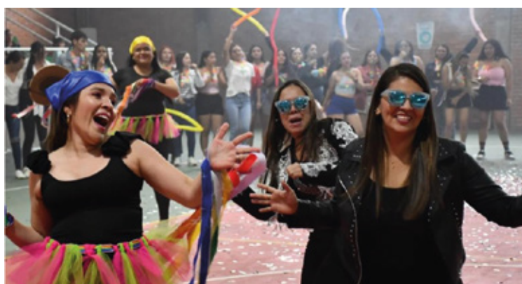
Docentes participantes del III Festival de Talentos “TO. TIENE TALENTO”.

El III Festival de Talentos “TO. TIENE TALENTO” contó con la entusiasta participación de estudiantes y docentes del ISER Pamplona. Este evento, realizado en el Coliseo del instituto, reunió a una amplia variedad de talentosos miembros de la comunidad educativa. Los estudiantes de diferentes programas académicos se unieron para mostrar sus habilidades artísticas, mientras que los docentes también se involucraron activamente, apoyando y animando a los participantes. La colaboración entre estudiantes y docentes fue fundamental para el éxito del festival, creando un ambiente de camaradería y apoyo mutuo.