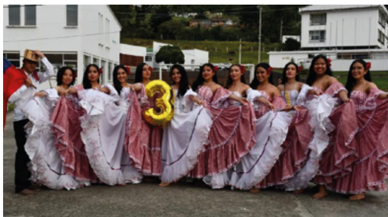
Estudiantes participantes del III Festival de Talentos “TO. TIENE TALENTO”.

Los participantes demostraron su talento, el festival ofreció una plataforma para que los estudiantes mostraran sus dotes musicales y cautivaran al público con sus interpretaciones. Las presentaciones de baile incluyeron una variedad de estilos, desde danzas tradicionales hasta coreografías contemporáneas. Así mismo se exhibieron piezas artísticas que reflejaban la creatividad y el talento de los participantes, permitiendo a la audiencia apreciar la diversidad y profundidad de las expresiones artísticas.