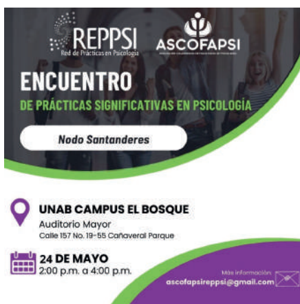
Poster de invitación al evento en la UNAB.