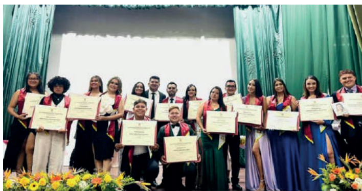
Estudiantes graduados del programa de Fonoaudiología en el semestre 2024-1 junto al director de programa, fotografía suministrada por el programa de Fonoaudiología.

¡Felicidades a todos los nuevos profesionales! Gracias por confiar en nosotros y permitirnos ser parte de su camino hacia el éxito. Les deseamos un futuro lleno de logros y satisfacciones, donde cada paso que den refleje la pasión y el conocimiento adquiridos durante su formación en nuestra institución.