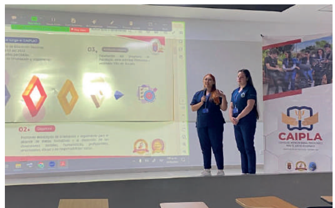
Presentación de ponencia por parte de las estudiantes, fotografía por los estudiantes.