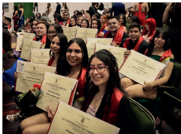
Fotografía de graduados del programa de Psicología en la sede Pamplona.

Además de los títulos de pregrado, también se entregaron 9 títulos de Especialización en Seguridad y Salud en el Trabajo, reconociendo a profesionales que han decidido profundizar sus conocimientos y habilidades en esta importante área.