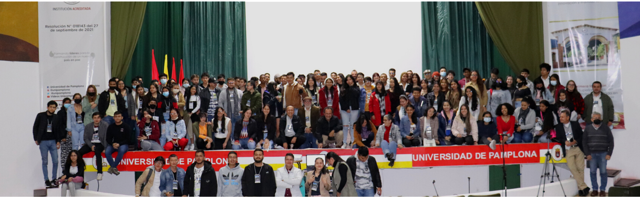
Estudiantes de arquitectura en el II Coloquio Internacional de Arquitectura

BOLETÍN DEL PROGRAMA DE ARQUITECTURA 2022-1