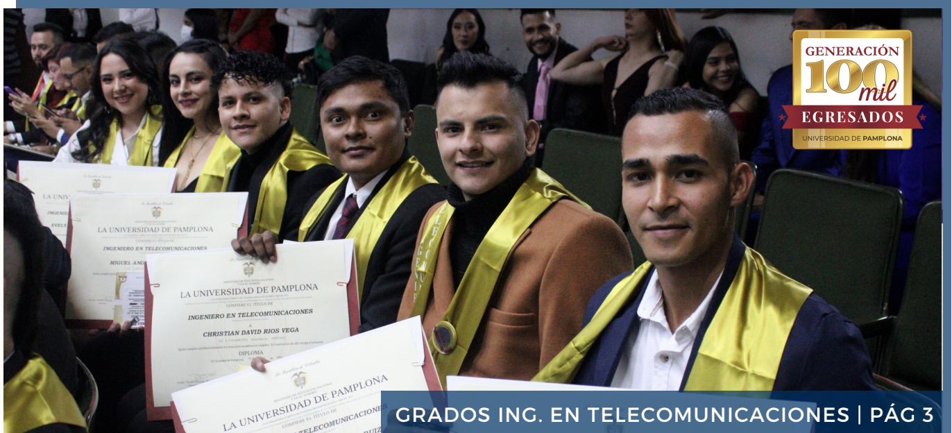
GRADOS ING. EN TELECOMUNICACIONES | PÁG 3

Ya se encuentran disponibles la quinta y sexta emisión del espacio radial del Programa de Ingeniería en Telecomunicaciones.