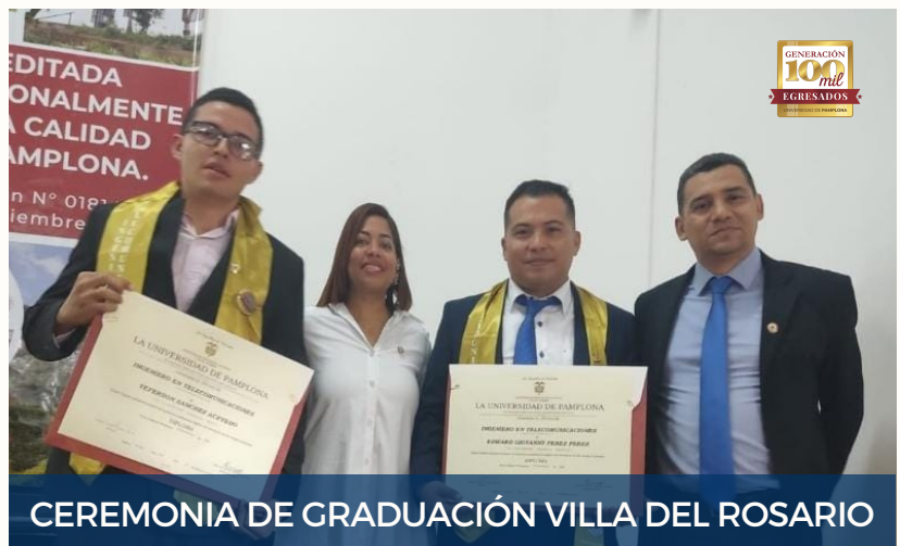
CEREMONIA DE GRADUACIÓN VILLA DEL ROSARIO