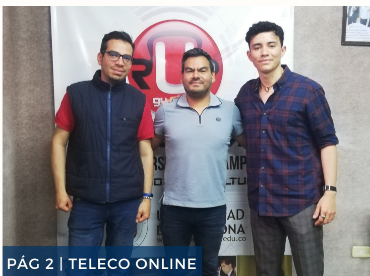
PÁG 2 | TELECO ONLINE