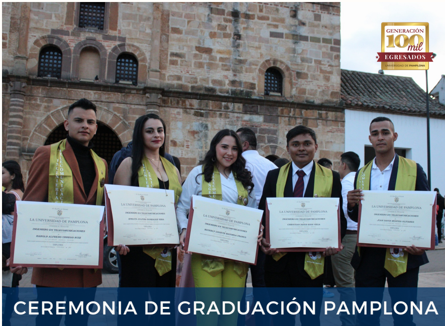
CEREMONIA DE GRADUACIÓN PAMPLONA

El día lunes 10 de octubre a las 2:30 p.m. se llevó a cabo en las instalaciones del Teatro Jáuregui, la ceremonia de grado de los seis nuevos Ingenieros en Telecomunicaciones, de la sede Pamplona. Los mejores deseos para la Promoción 2022-2.