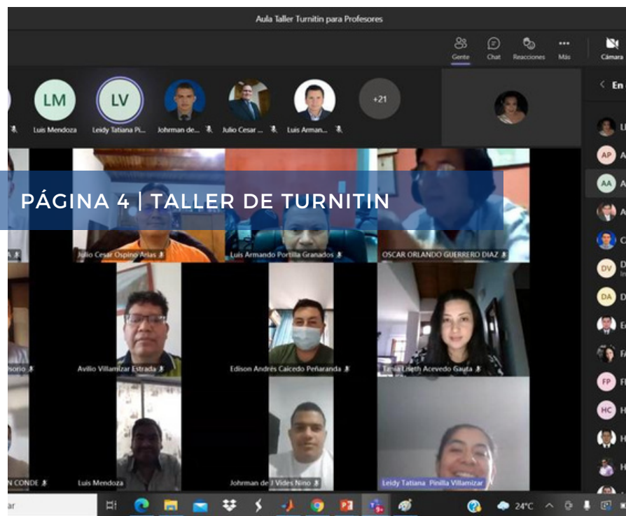
PÁGINA 4 | TALLER DE TURNITIN