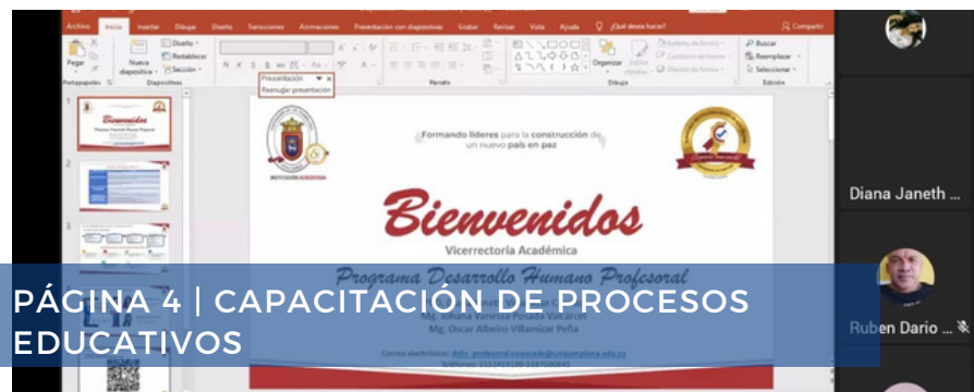
PÁGINA 4 | CAPACITACIÓN DE PROCESOS EDUCATIVOS