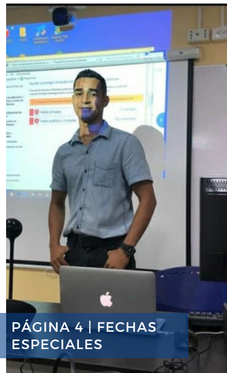
PÁGINA 4 | FECHAS ESPECIALES