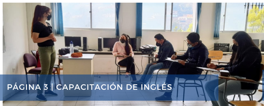
PÁGINA 3 | CAPACITACIÓN DE INGLÉS