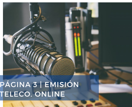
PÁGINA 3 | EMISIÓN TELECO. ONLINE