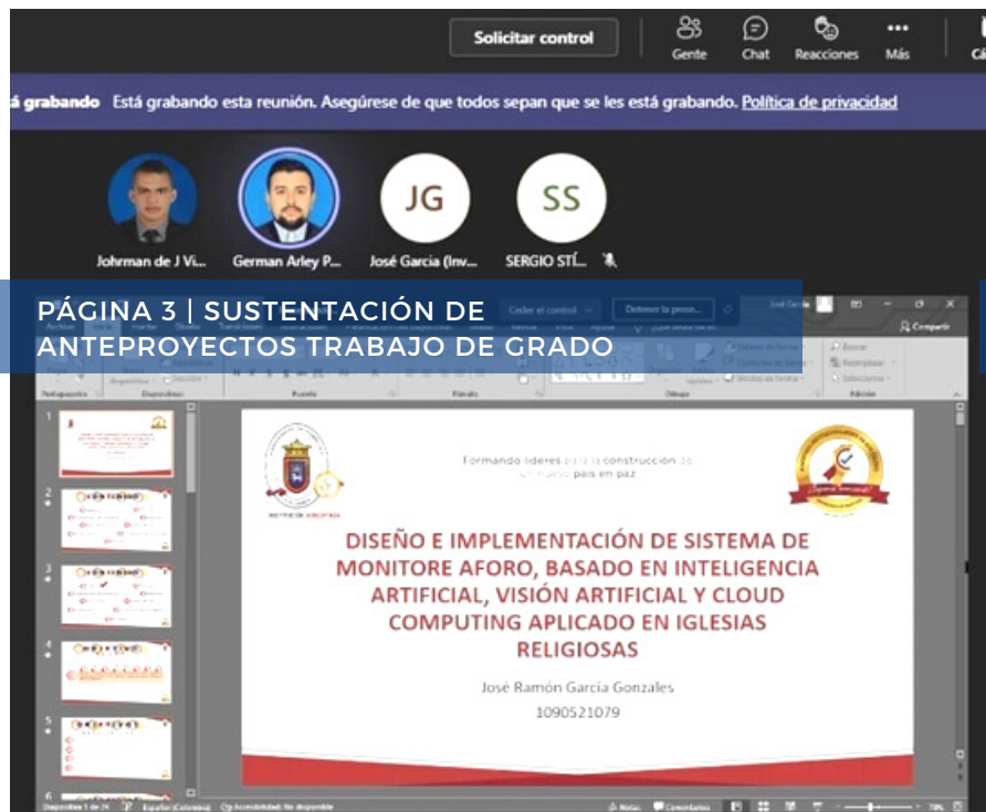
PÁGINA 3 | SUSTENTACIÓN DE ANTEPROYECTOS TRABAJO DE GRADO