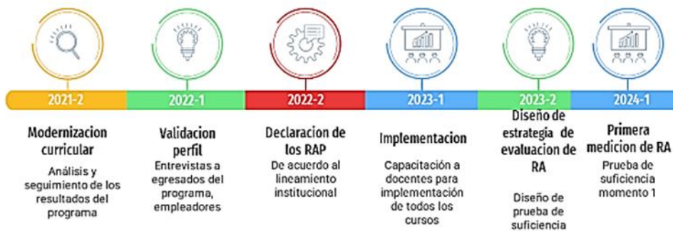
figura 2. MOMENTOS DE SEGUIMIENTO Y EVALUACIÓN DE LOS RESULTADOS DE APRENDIZAJE EN EL PERIODO DE FORMACIÓN.