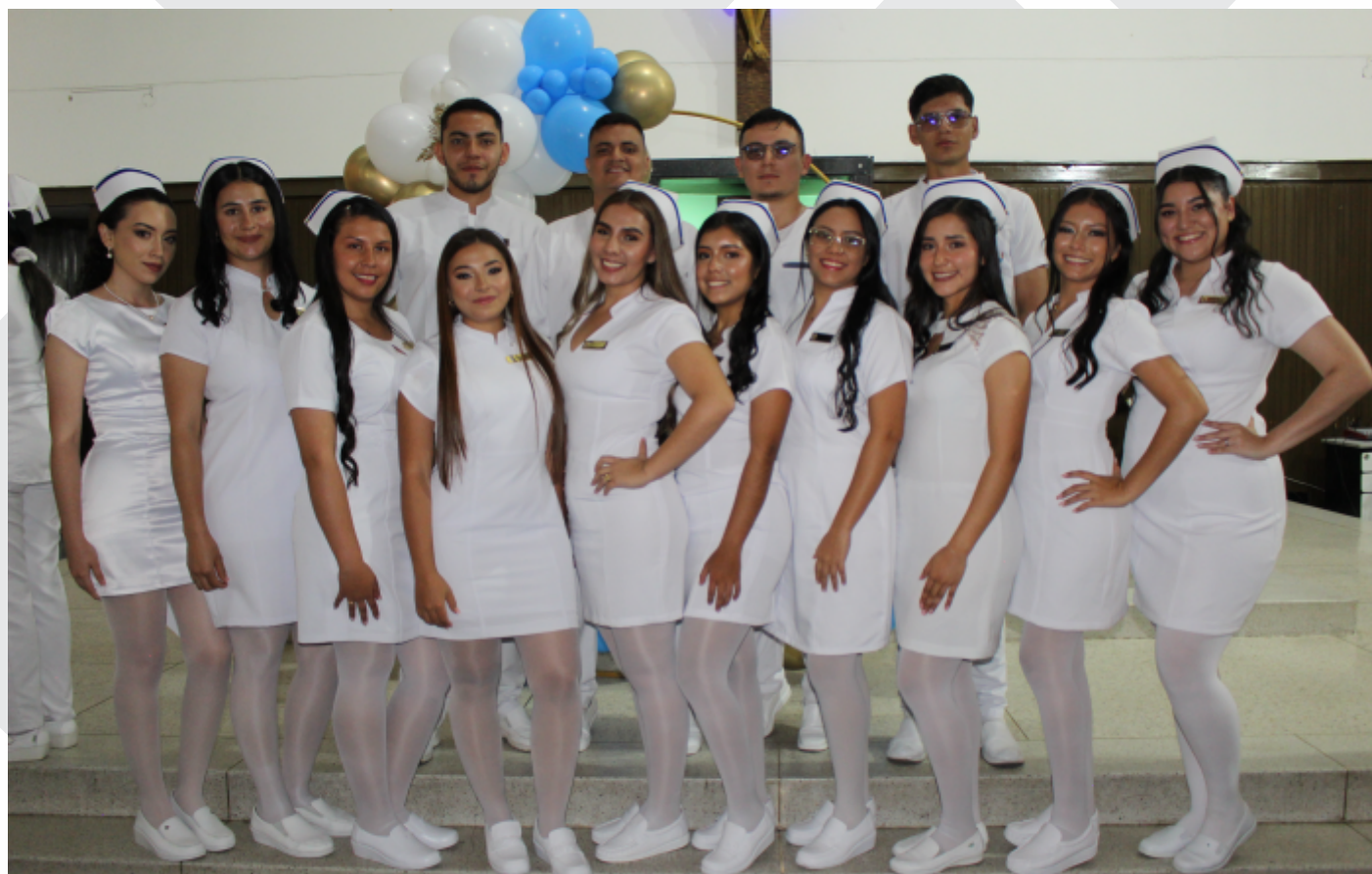
15 jóvenes se graduaron como enfermeros de la Universidad de Pamplona