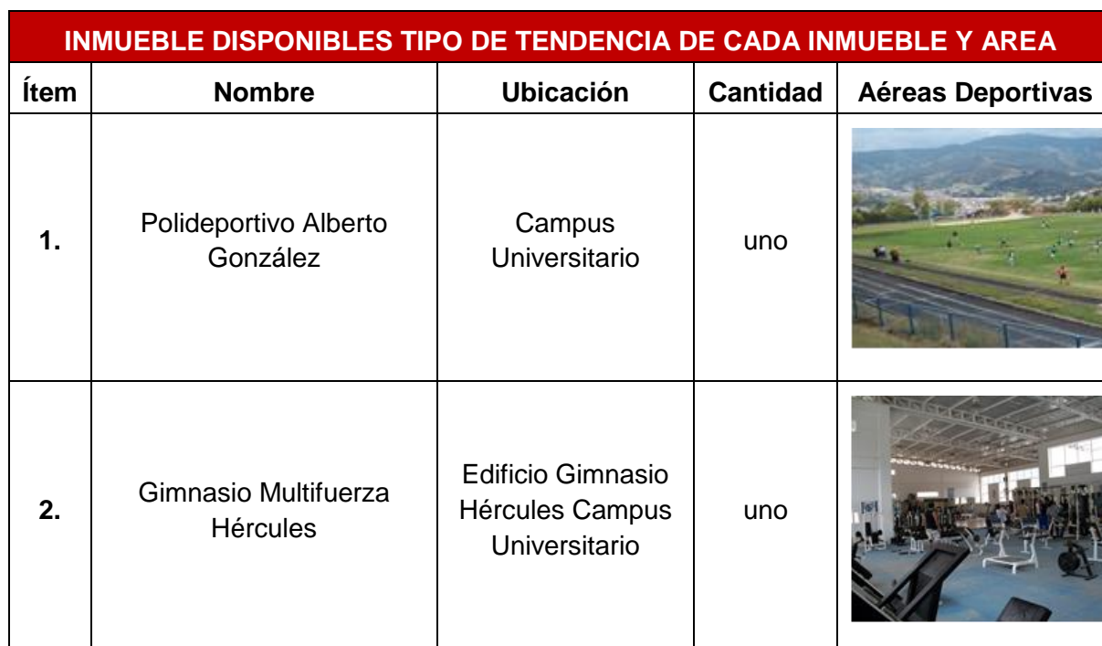
TABLA 31. ÁREAS DE RECREACIÓN/ESPARCIMIENTO