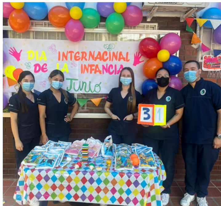
Fotografía encuentro por la niñez

Dentro de la actividad, los estudiantes reforzaron los conocimientos brindados en las diferentes asignaturas vistas, previamente a Prácticas.