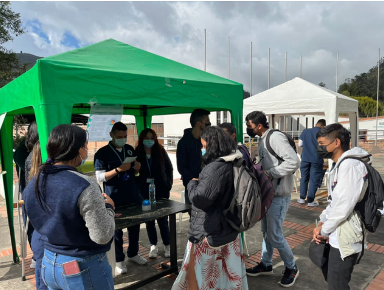
Campaña Salud Mental