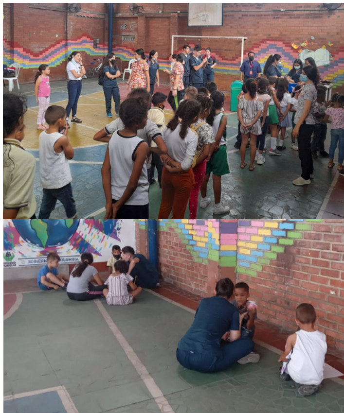
Psicología del desarrollo infantil