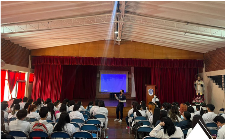
Reflexión y análisis

Los psicólogos en formación de las asignaturas Psicología de la Personalidad y Valoración Psicológica desarrollaron una estrategia de prevención y promoción en las instalaciones del Colegio Águeda Gallardo de Villamizar. El objetivo de la jornada fue propiciar espacios de reflexión y análisis sobre los primeros auxilios psicológicos en estudiantes y docentes de sexto a once grado, con el apoyo de los psicólogos en formación que se encuentran realizando su práctica formativa en esta Institución Educativa.