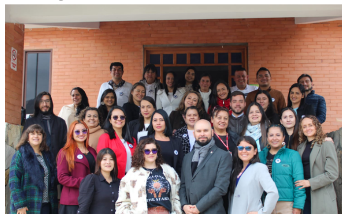
Docentes sede Pamplona

En esta jornada se abordaron diferentes temas y se presentaron proyectos a desarrollar para orientar el mejoramiento del programa desde la innovación, extensión social e investigación.