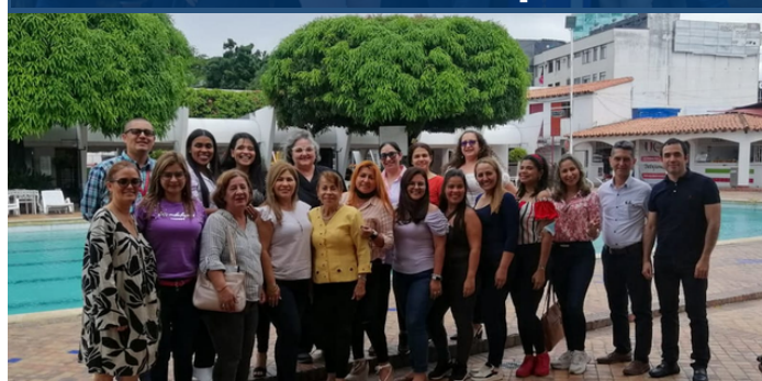
Docentes sede Villa del Rosario