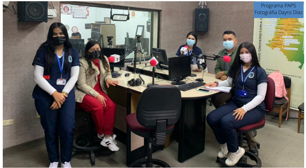
Programa PAPS

Desde Radio Universidad de Pamplona (94.9 F.M) se emitieron diferentes programas radiales realizados por psicólogos en formación, en los cuales se abordaron diferentes temáticas afines a la psicología y la salud mental, desde Practicas Formativas I y II los estudiantes orientaron a la audiencia en temas de Primeros Auxilios Psicológicos (PAPS), la influencia sobre el ambiente de trabajo y estado de bienestar y el fortalecimiento de la salud mental en la infancia.