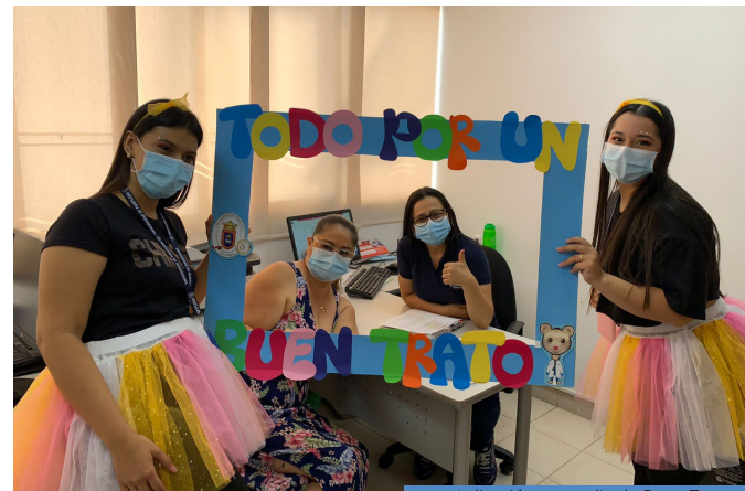
Aplicación campaña de Buen Trato