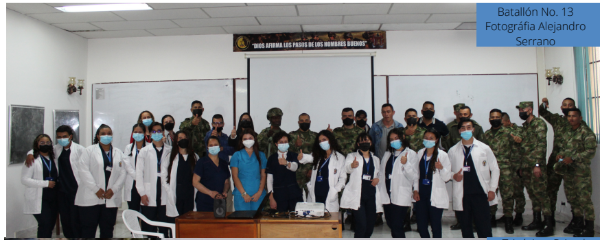
Batallón No. 13