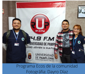
Programa Ecos de la comunidad