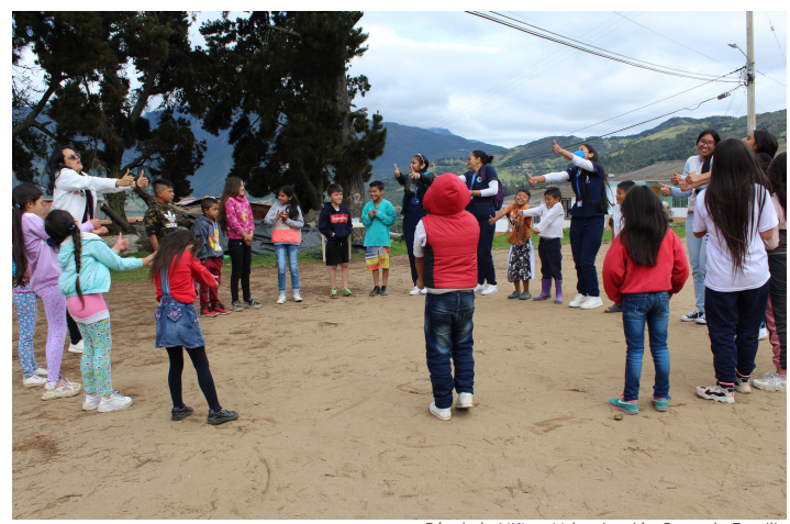
Día de la Niñez, Urbanización Sagrada Familia