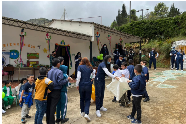
Día de la Niñez, Escuela Monteadentro