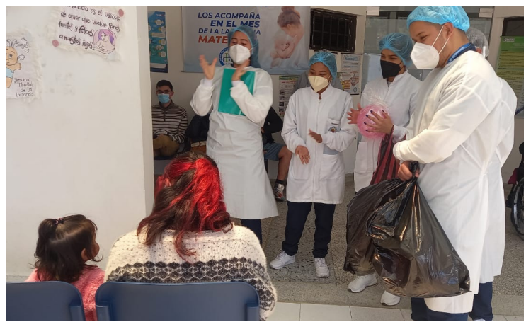
Día de la Niñez, Hospital San Juan de Dios