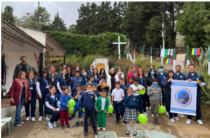
Día de la Niñez, Escuela Monteadentro