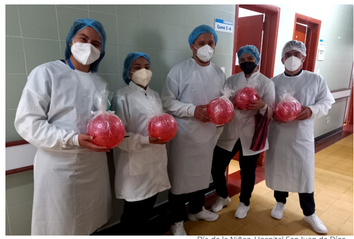
Día de la Niñez, Hospital San Juan de Dios