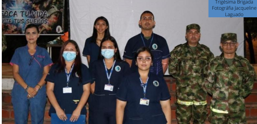
Trigésima Brigada