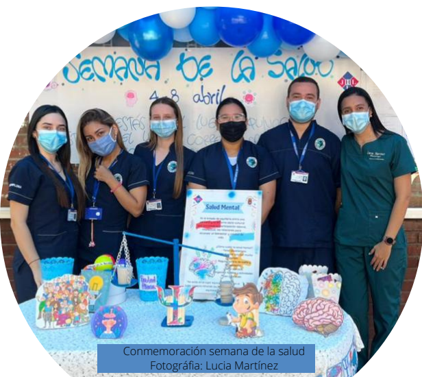
Conmemoración semana de la salud