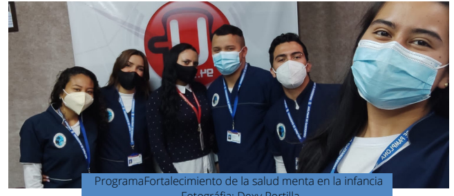
Programa Fortalecimiento de la salud mental en la infancia