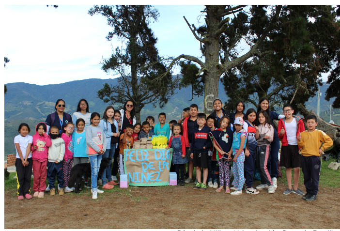
Día de la Niñez, Urbanización Sagrada Familia