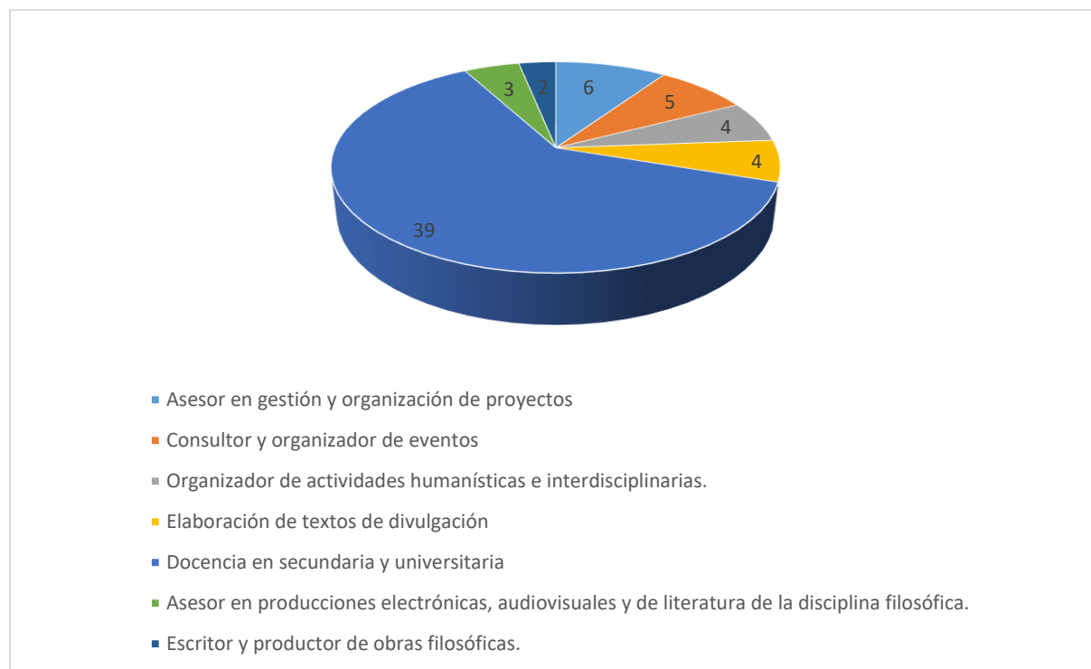
Figura No. 4

El programa de filosofía de la Universidad de Pamplona viene desarrollando encuentros permanentes con sus egresados y seguimiento a su desempeño profesional en los distintos territorios en los que se encuentran aportando a la construcción de país. En razón a esto, la Figura No. 4. visualiza los distintos sectores sociales en los que los egresados laboran y dan cumplimiento al perfil de egreso.