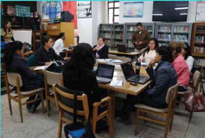
CENTRO DE RECURSOS