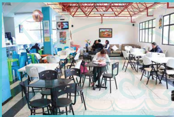
CAFETERÍA (Las Sombrillas)