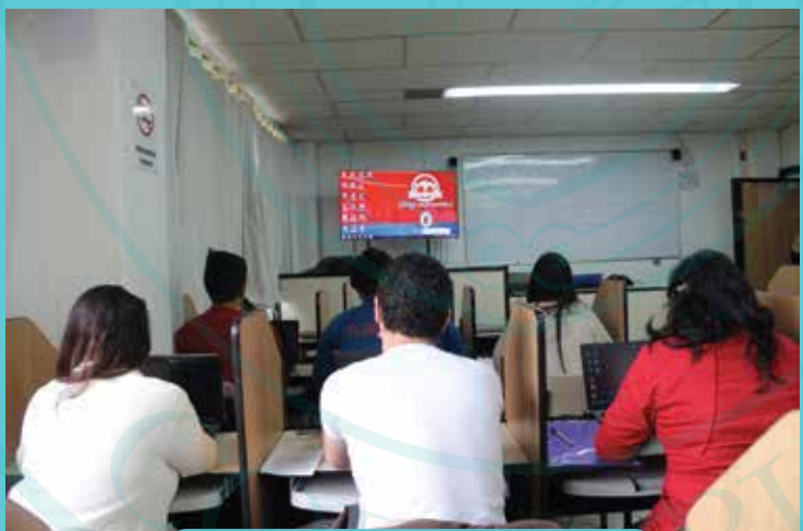
LABORATORIO RG 203