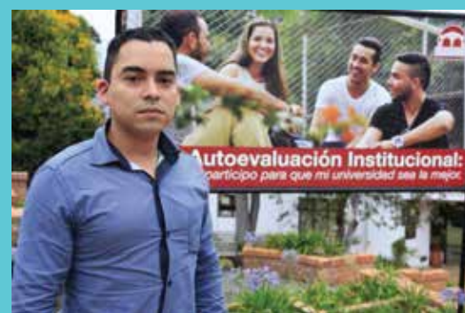
DIR. PROGRAMA PLEX