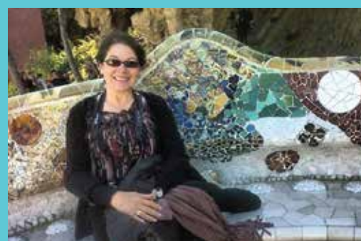
DIR. DEPARTAMENTO PLEX