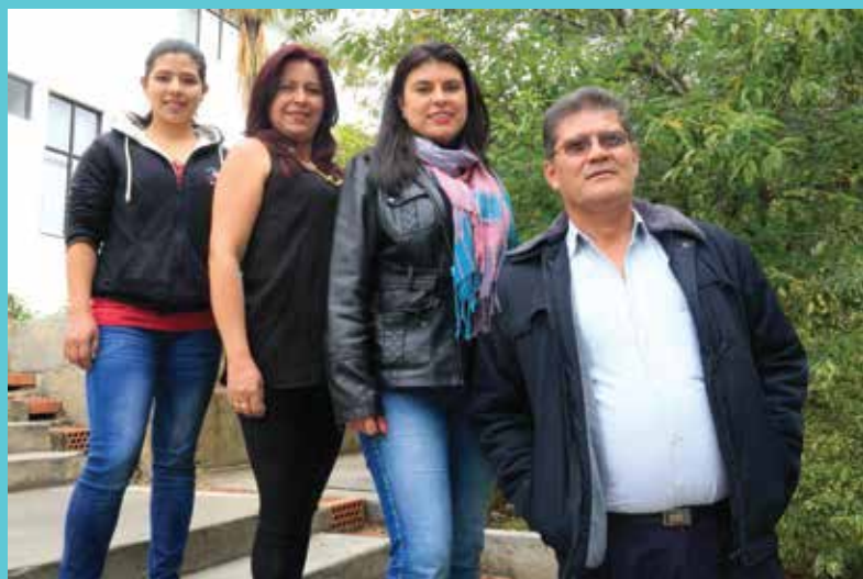
AUX ADMINISTRATIVOS PLEX