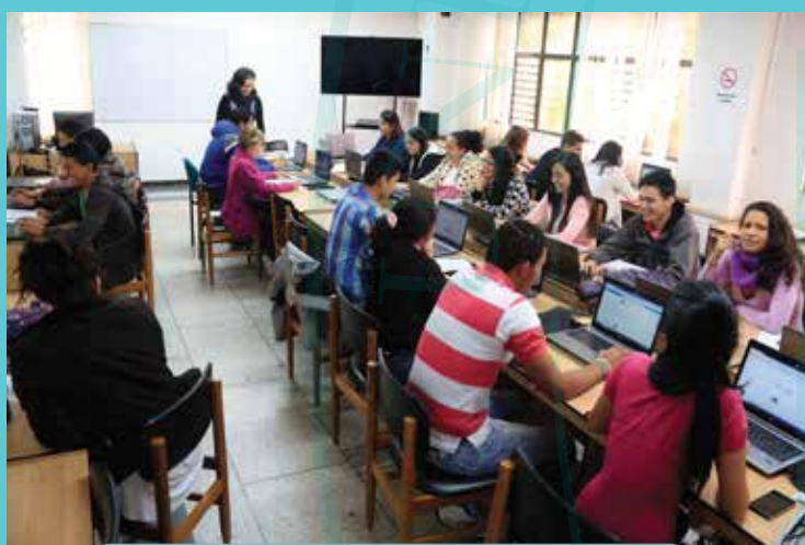
LABORATORIO RG 204