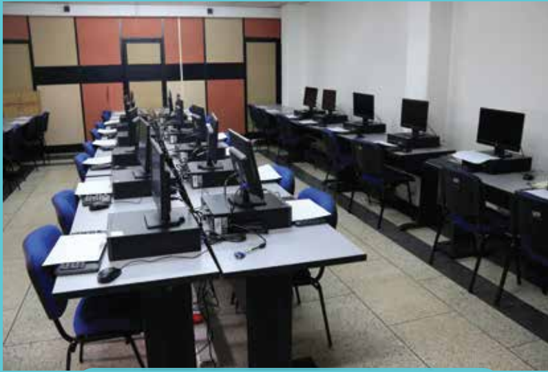
LABORATORIO RG 206