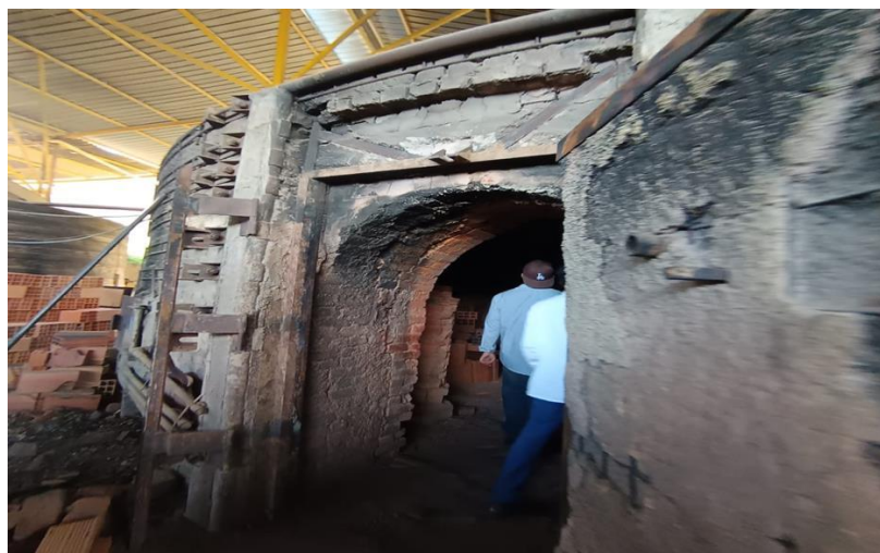
Horno tipo Iglú donde se calienta la arcilla para convertirla en ladrillo