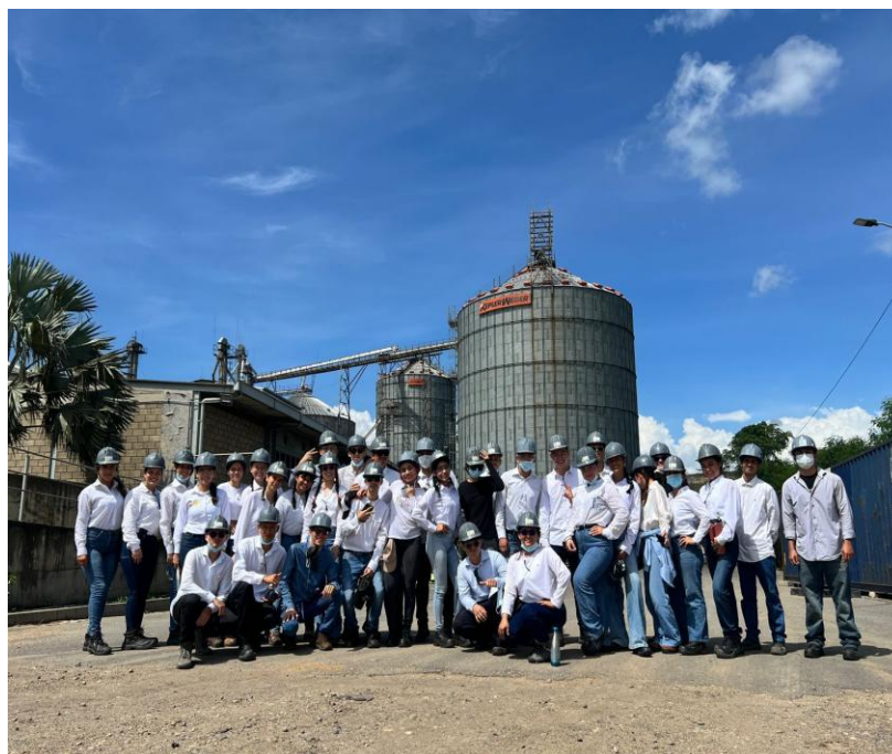
Grupo de estudiantes