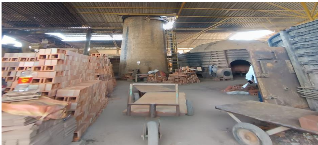
Almacenamiento del producto