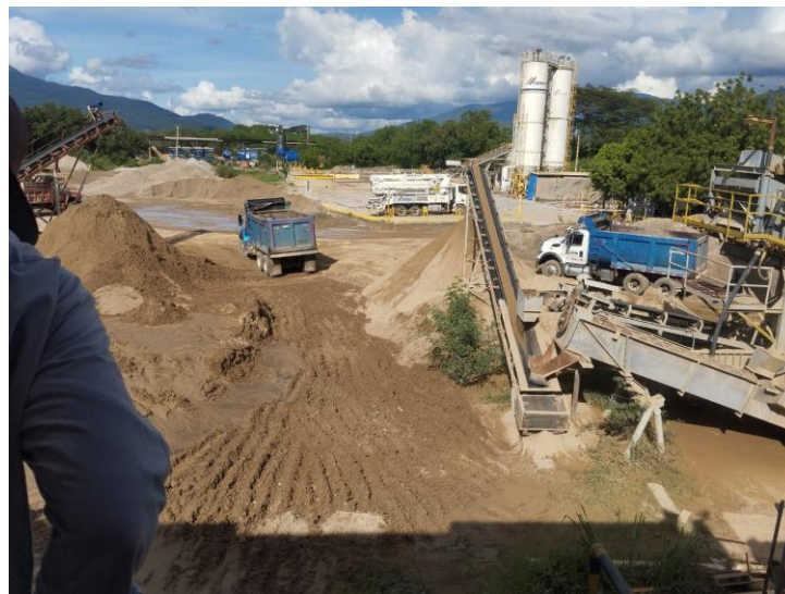
Área de trituración