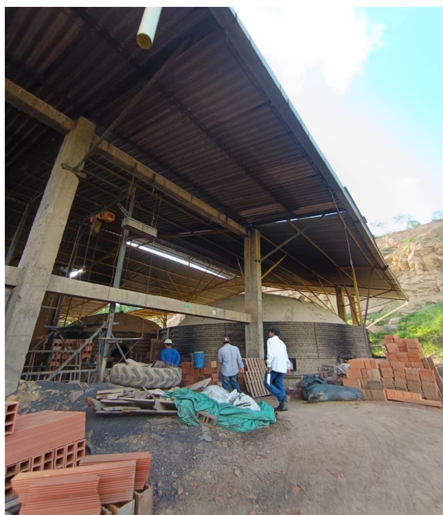
Entrada a la parte de producción de la fábrica