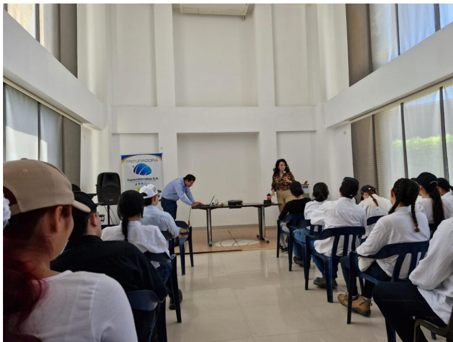
Charla sobre la empresa