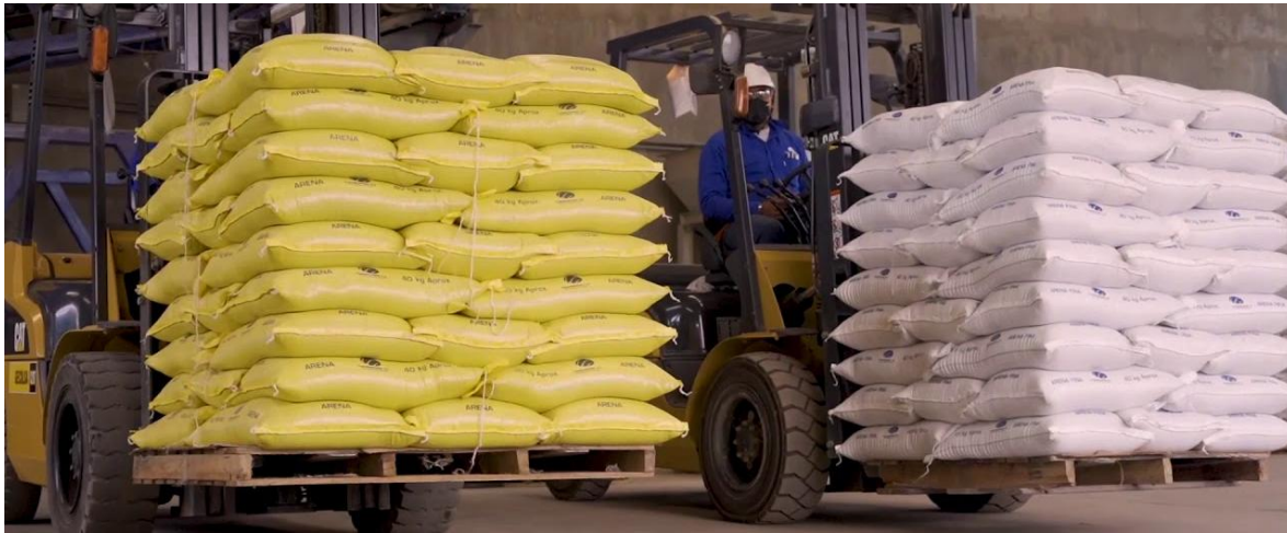
Clasificación y transporte