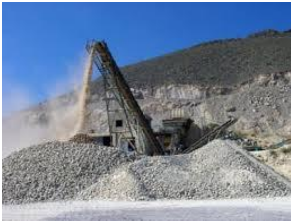
Área de Producción