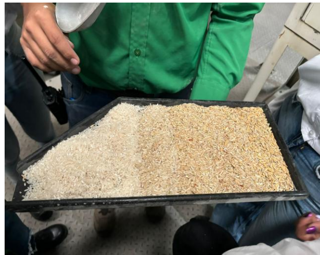
Muestra del producto