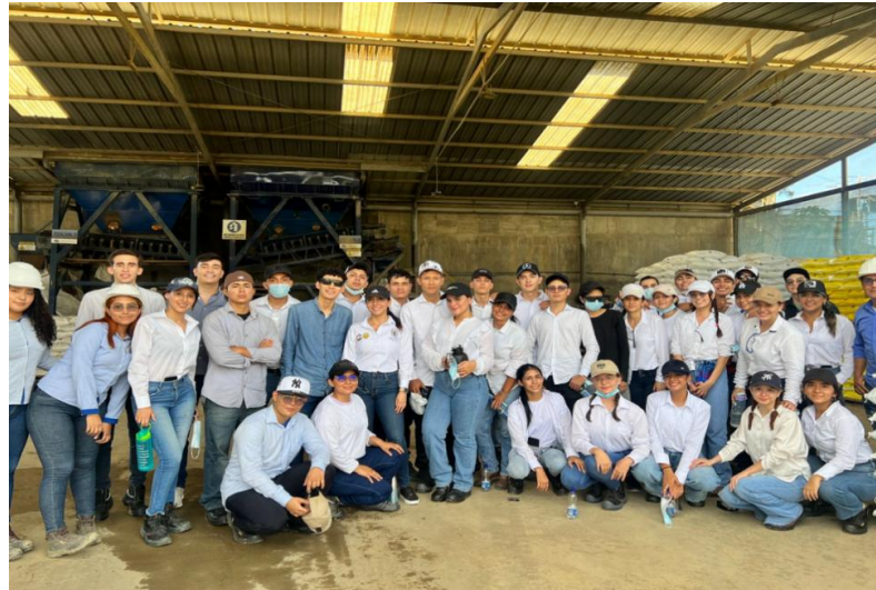
Estudiantes Administración de Empresas