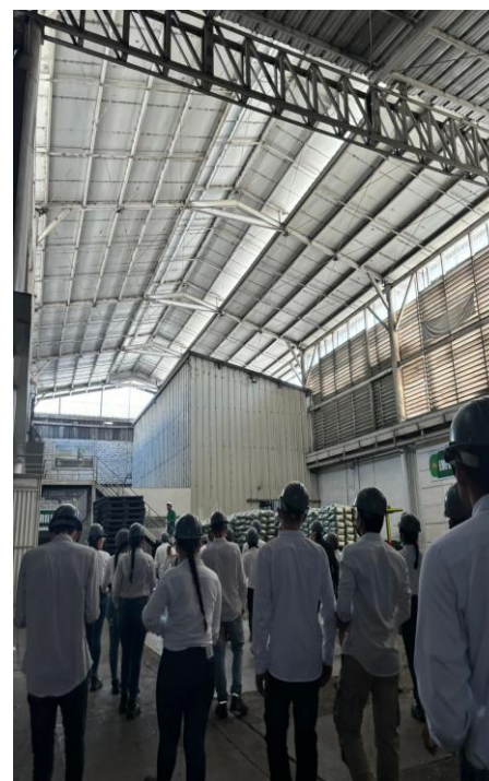
Recorrido por el área de empackado