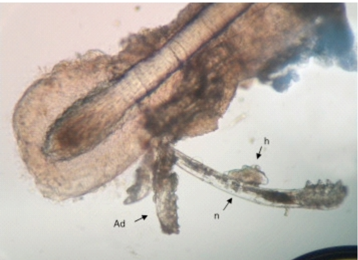
VISTA MICROSCÓPICA DE UN ÁCARO D.

Demodex y morfotipos de su ciclo biológico observados en pestaña de paciente con DEBS. Pestaña parasitada con adulto (Ad), huevo (h) y ninfa (n) de D. folliculorum ,