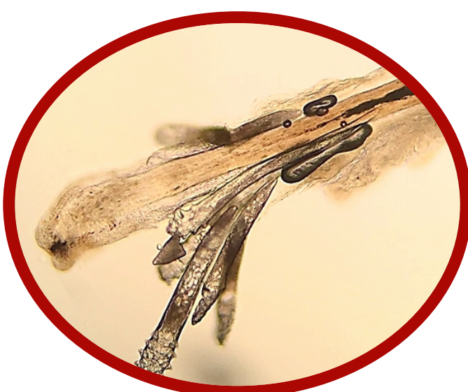
Imagen microscópica de Demodex en las pestañas

Demodex y morfotipos de su ciclo biológico observados en pestaña de paciente con DEBS. Pestaña parasitada con adulto (Ad), huevo (h) y ninfa (n) de D. folliculorum ,