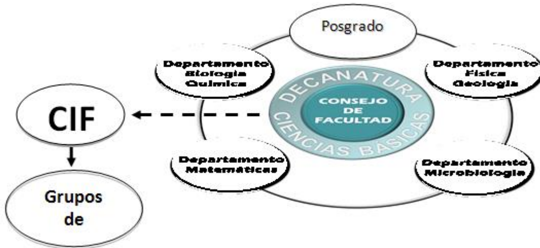
Figura 3.2 Estructura Orgánica de la Facultad de Ciencias Básicas