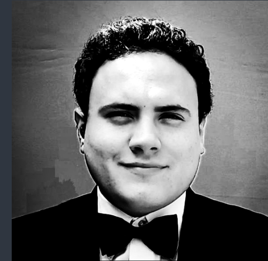
Diego Felipe Mora Atuesta

Profesora de la Cátedra de Piano Pianista. caroline.santos@unipamplona.edu.co Pianista egresada de la Universidade Federal da Bahia (UFBA) y especialista en Educación Artística de la Universidad de Pamplona (Colombia). También estudió piano en el Centro Universitario de Cultura e Arte (CUCA), en Feira de Santana (Brasil), período en que realizó diversos recitales de piano en el Teatro do CUCA. En 2010 fue invitada para tocar con la banda Salsa Solera en Alemania. También tocó en la Sala do Coro del Teatro Castro Alves (Brasil), en el Auditorio de la Escuela de Música de la Universidade Federal da Bahia y en su Rectoría. Fue profesora de música en la Escola Crescere y profesora de piano en el conservatorio de Música Schubert (Brasil) y en el Centro Musical Teodoro Salles. Fundó y coordinó la Escuela de Música de la Igreja Batista Alvorada em Saco do Capim. Actualmente es estudiante de Maestría en Educación en la Universidad Autónoma de Bucaramanga (Colombia) y docente de piano en la Universidad de Pamplona.