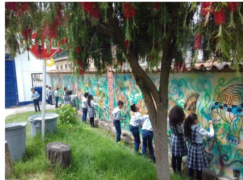
Tomada del: Doc. de Trabajos de Grado recopilados por la dirección de la Esp. Edu. Artística.