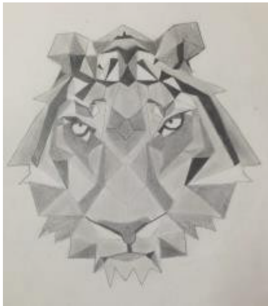
Tomada del: Doc. de Trabajos de Grado recopilados por la dirección de la Esp. Edu. Artística.