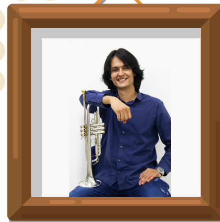
Tomada por: Carolina Chacón. Docente de la Lic. Edu. Artística.