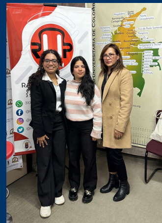
AGUA Y SANEAMIENTO BÁSICO: UN D.H

El programa radial 'Con Criterio' ha tenido el privilegio de emitir hasta el momento doce emisiones sintonizadas en la 94.9 FM Radio Universidad de Pamplona. Durante estas transmisiones, hemos abordado temas relevantes, como la 'liquidación de una empresa' y el 'agua y saneamiento básico como un derecho humano', demostrando nuestro compromiso desde el Consultorio Jurídico en brindar orientación experta para resolver cualquier situación legal de manera óptima. Además, encontramos de la radio un medio masivo efectivo para llegar a nuestra audiencia y exaltamos la importancia que este medio de comunicación tiene en nuestra labor profesional.