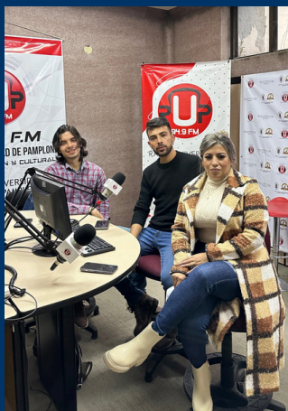
COMO SE LIQUIDA UNA EMPRESA