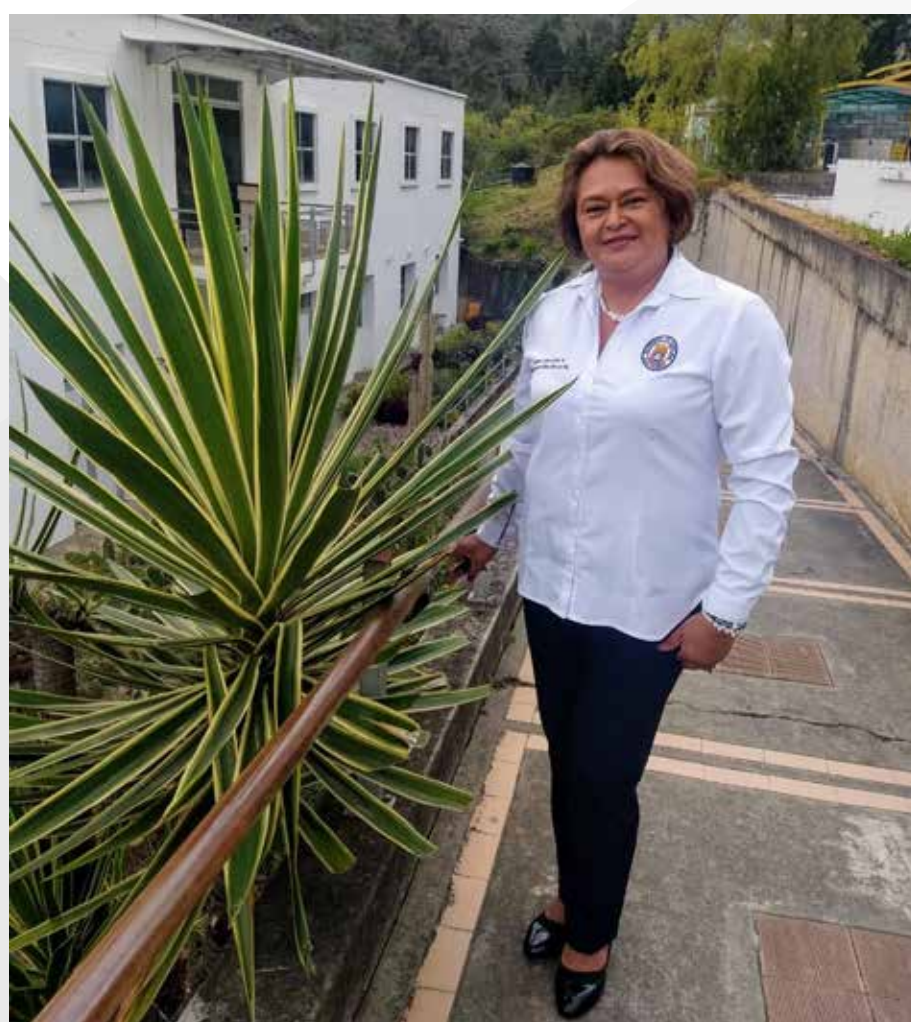
Fotografía recibida vía whatsapp

“Me motiva trabajar en la oficina el poder contribuir desde mi experiencia en la organización y estructura para que esta pueda evolucionar y logre alcanzar la acreditación institucional”.