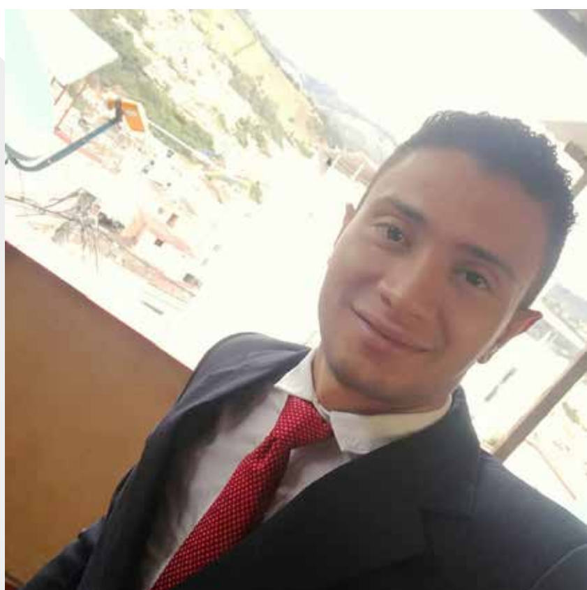
Fotografía recibida vía whatsapp

“Tener la oportunidad de vivir una experiencia asumiendo un cargo importante”.