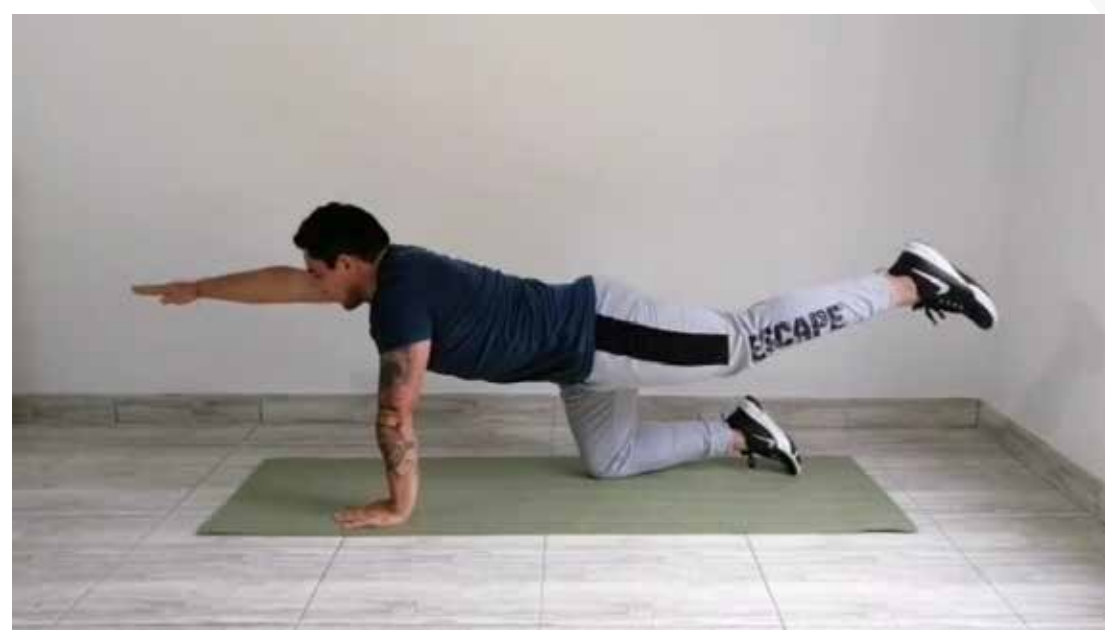
Captura de pantalla de uno de los videos