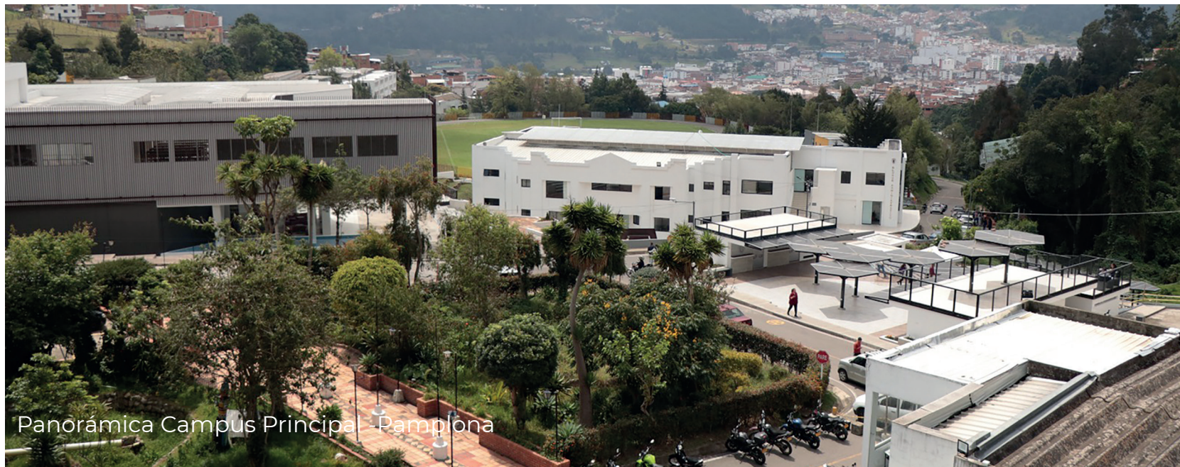
Panorámica Campus Principal - Pamplona