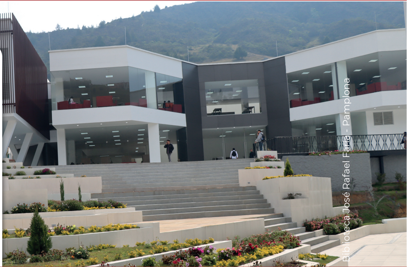
Biblioteca José Rafael Fariá - Pamplona