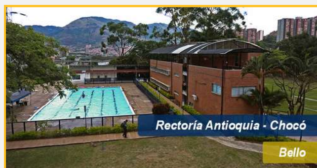
Rectoría Antioquia - Chocó