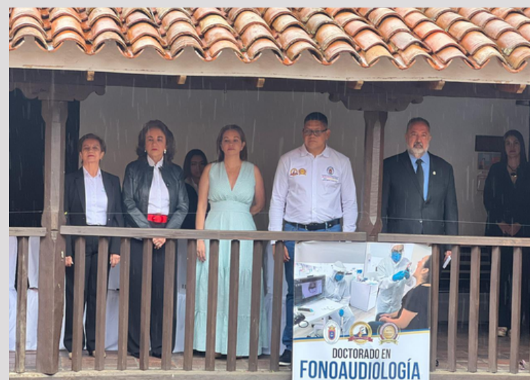
Ceremonia Convocatoria 35