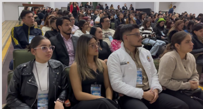
Congreso Internacional de psicología Teatro Jauregui

Este congreso se caracteriza por la participación de expertos nacionales e internacionales que comparten sus investigaciones y experiencias, generando un diálogo enriquecedor entre diferentes perspectivas teóricas y metodológicas. De esta manera, se promueve la construcción colectiva del conocimiento y se fortalece el pensamiento crítico en torno a problemáticas actuales que impactan la salud mental y el bienestar de las sociedades.