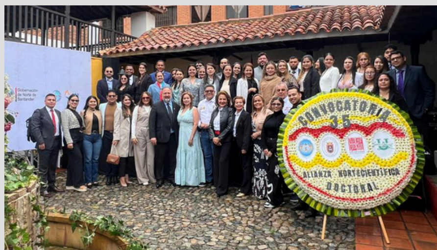
Ceremonia Convocatoria 35