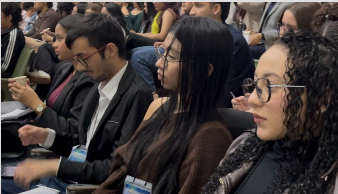
Congreso Internacional de psicología Teatro Jauregui

Además, este tipo de eventos fortalece la formación integral de los estudiantes de la Universidad de Pamplona, al brindarles la oportunidad de interactuar con investigadores, ampliar sus redes académicas y conocer nuevas oportunidades de desarrollo profesional. En consecuencia, el congreso no solo impulsa la investigación y la innovación, sino que también contribuye al posicionamiento de la institución como un referente en la formación y producción de conocimiento en el ámbito psicológico.