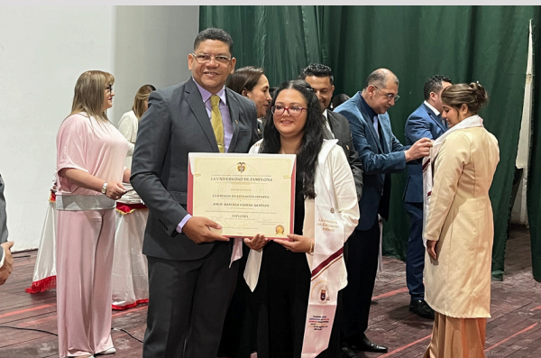
Ceremonia de Grados Facultad de Educación

La Universidad de Pamplona entregó al país un total de 1.404 nuevos profesionales durante las ceremonias de graduación correspondientes al semestre 2026-1, realizadas los días 13 y 14 de abril en el emblemático Teatro Jáuregui, en Pamplona, y el 15 de abril en el auditorio Jossimar Calvo, en Villa del Rosario. Con estos actos protocolarios, la institución reafirma su compromiso con la formación integral y la proyección de talento humano altamente calificado, que se integra a diversos sectores del desarrollo nacional con el sello Unipamplona.