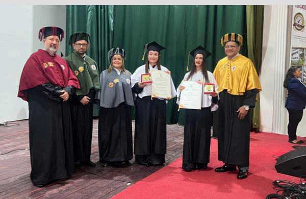
Ceremonia de Posgrados 2026-1