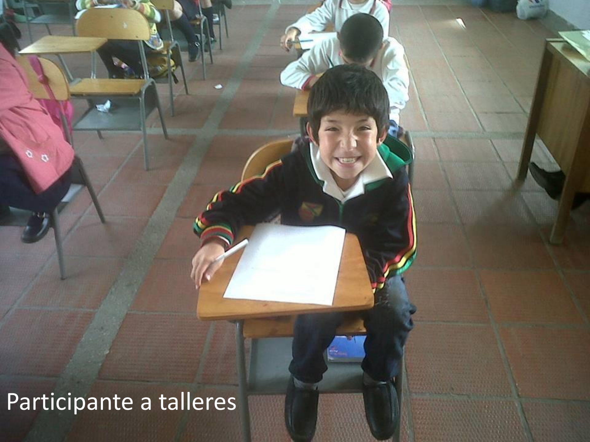
Participante a talleres